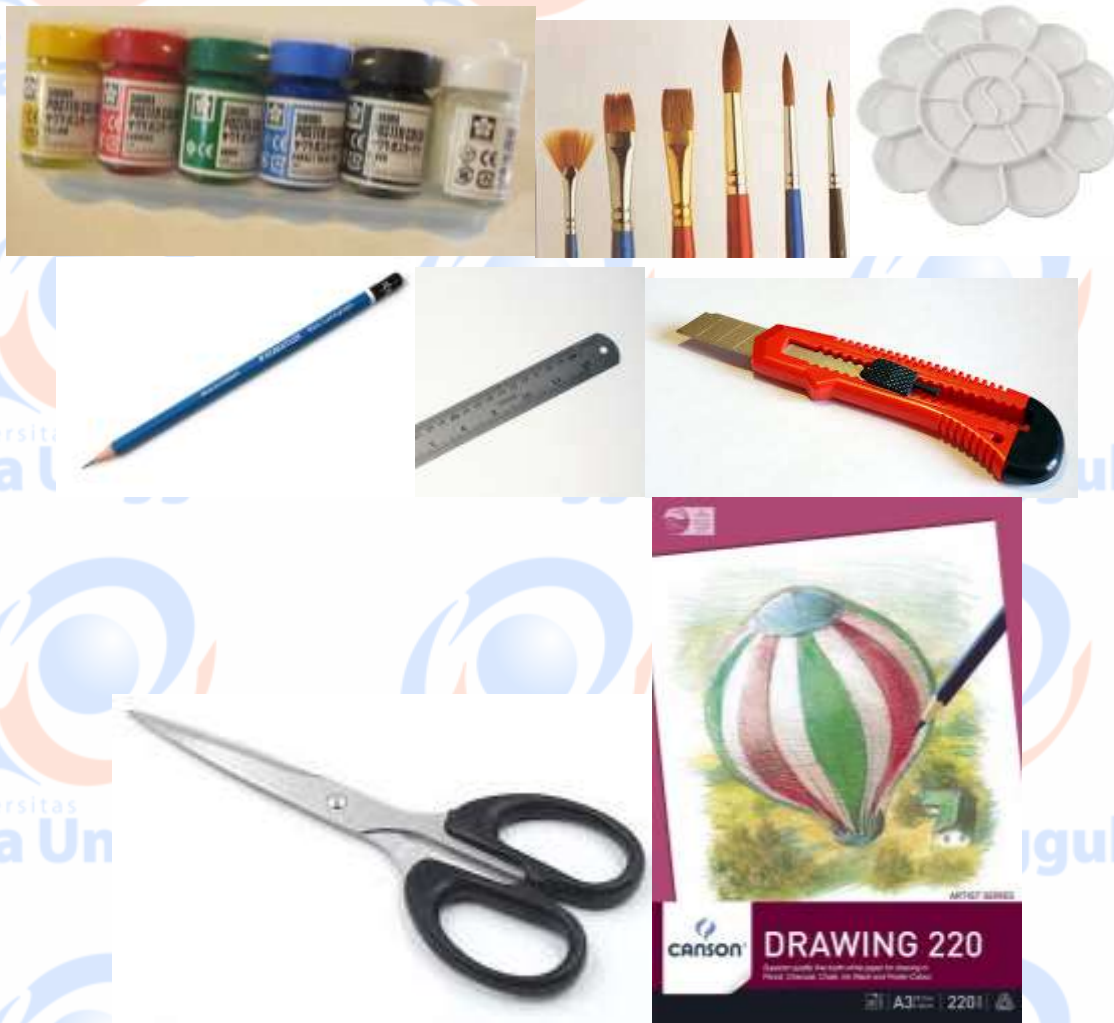
Gambar 1. Alat-alat gambar dan buku sketsa ukuran A3