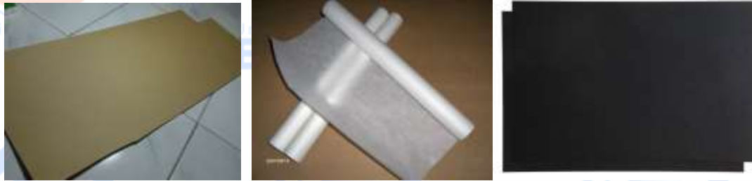
Gambar 4. Kertas hardboard (kiri), kertas minyak (tengah) dan kertas linen hitam (kanan)