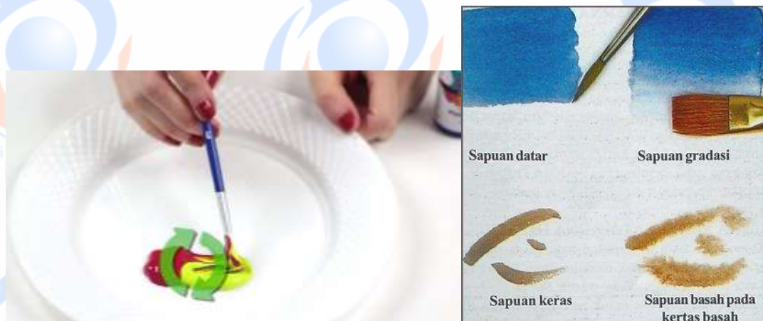
Contoh 3. Teknik mencampur warna (kiri) dan teknik sapuan kuas (kanan)