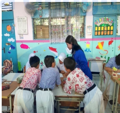
Siswa belajar bersama dalam kelompok belajarnya