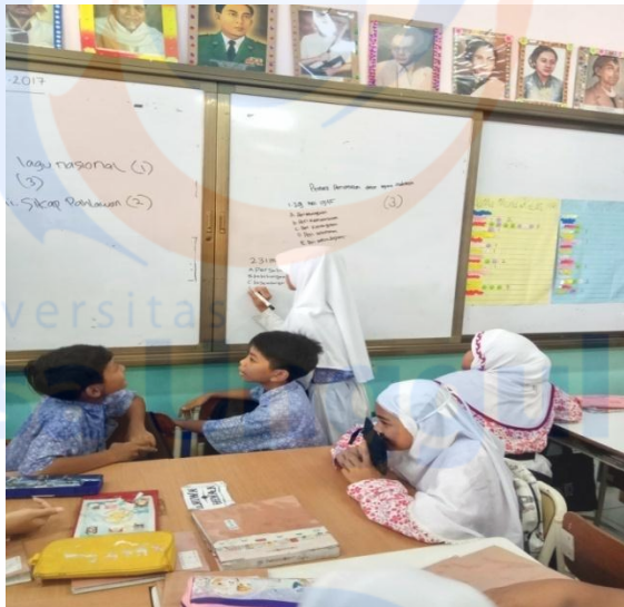
Perwakilan tiap kelompok mempresentasikan hasil Lembar Kerja Siswa (LKS)