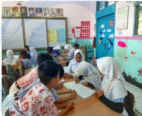
Masing-masing kelompok ditempatkan dalam meja turnamen