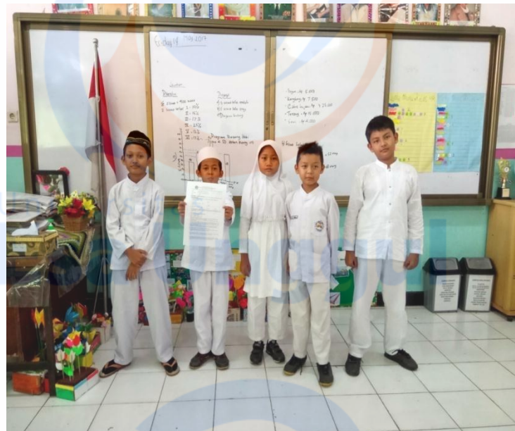
Penghargaan atau Reward kepada kelompok belajar terbaik