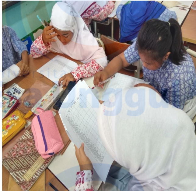
Siswa mengisi lembar angket yang telah di bagikan oleh guru