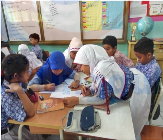
Siswa saling mengajarkan temannya yang masih belum paham mengenai pelajaran tersebut