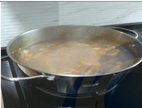
Perebusan kaldu udang