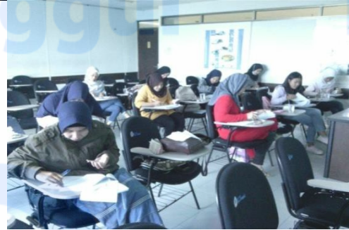
Penilaian organoleptik oleh panelis