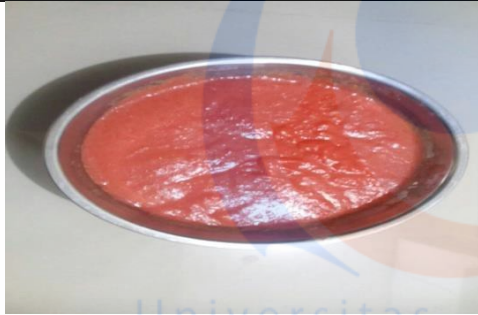
Sup krim segar