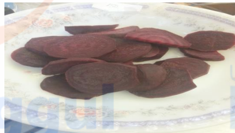
Bit yang telah di blanching