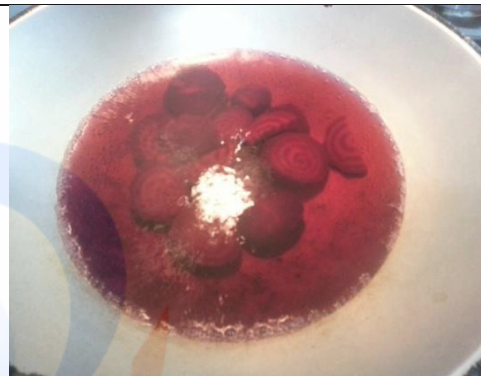
Blanching bit merah selama 2 menit