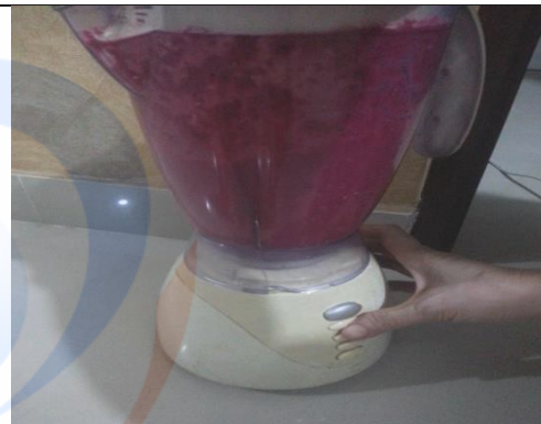
Menghaluskan bahan bahan