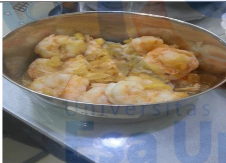
Hasil tumisan udang dengan bahan tambahan lain