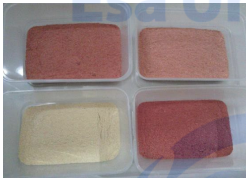
Hasil pengeringan sup krim menjadi bubuk