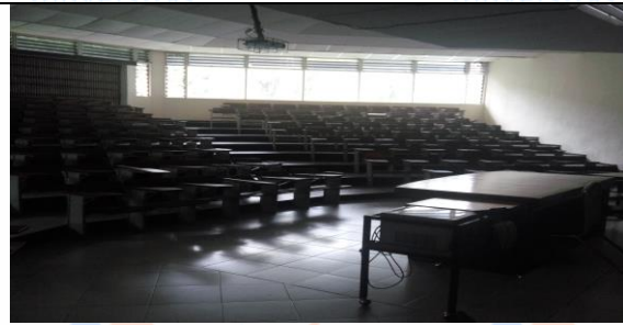
Studio class room