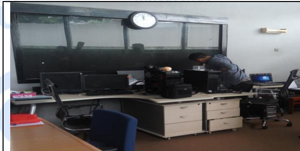
Studio semi (multi media)