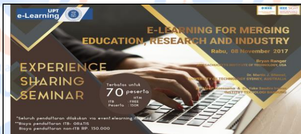
Elearning merging education