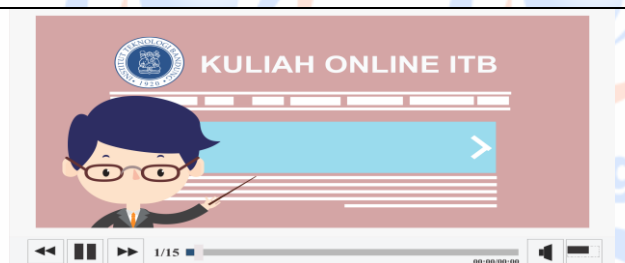
Pembelajaran dengan SCORM