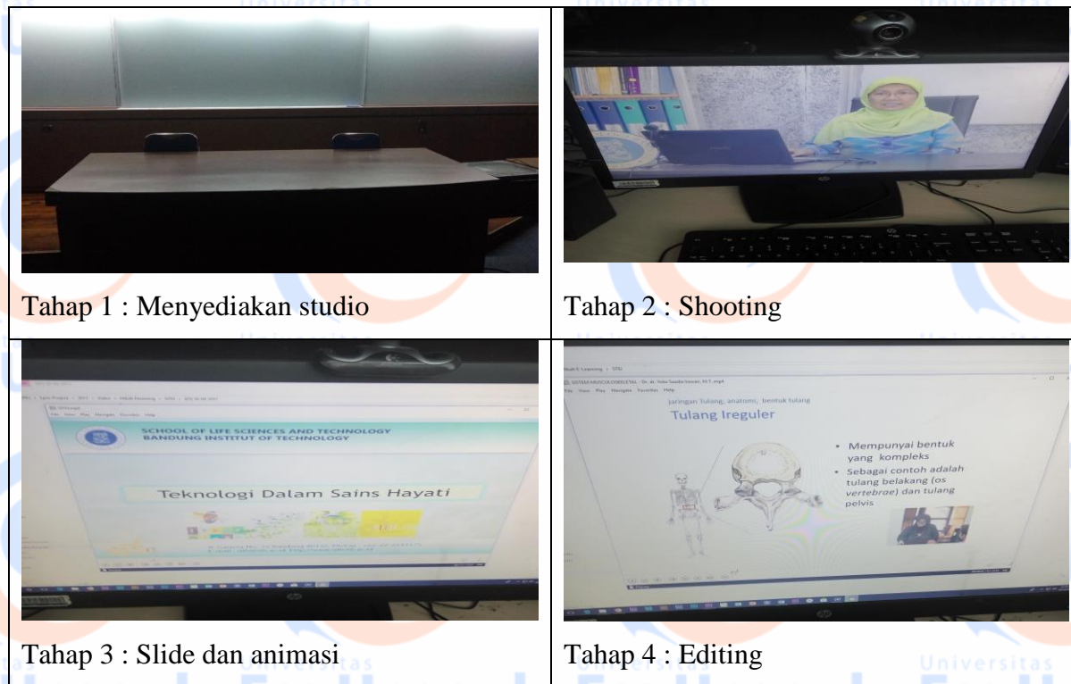
Tahap 1 : Menyediakan studio