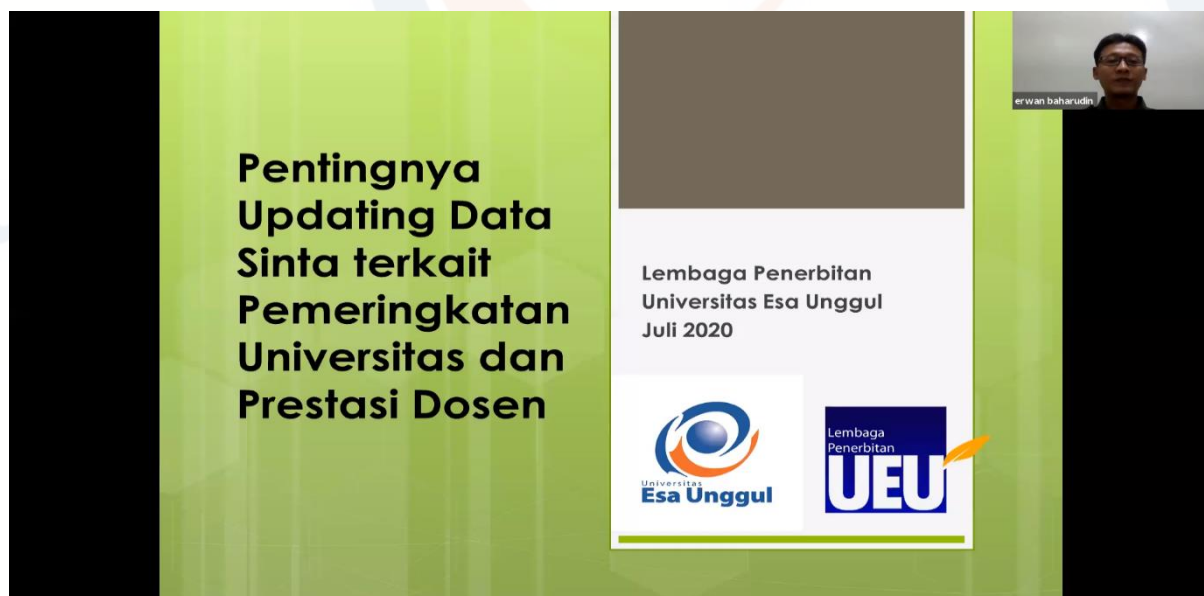
Gambar 1. Kegiatan Sosialisasi melalui aplikasi Zoom

Setelah sesi penyampaian materi dan sesi tanya jawab selesai maka responden mengisi polling yang sudah dibuat. Peserta yang masuk dalam room meeting sebanyak 87 orang, namun dari sejumlah peserta yang masuk yang mengisi polling kegiatan edukasi online ini hanya 44 orang. Peserta lainnya tidak mengisi dikarenakan keterlambatan pengisian polling , ada keperluan lain sehingga left sebelum acara selesai, dan tidak berkenan mengisi yaitu sebanyak 43 orang. Berikut pertanyaan polling yang di ukur dari materi updating data sinta :