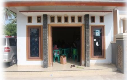
Gambar 1. Lokasi Pelaksanaan PKM di Pendopo Kelurahan Desa Kohod