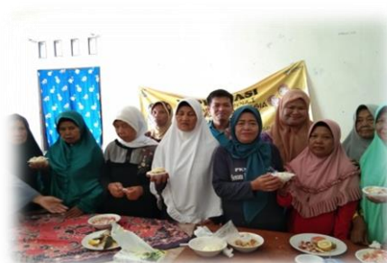
Gambar 4. Pelaksanaan PKM GISELA di Desa Kohod

Kegiatan Pengabdian Kepada Masyarakat yang dilakukan oleh Tim Pengabdian Kepada Masyarakat dari Universitas Esa Unggul di Desa Kohod berupa pemberian materi melalui ceramah dan praktik, diikuti oleh 20 orang lansia. Kegiatan ini berlangsung selama 6 bulan (April-September 2019). Pada pertemuan pertama dilakukan pemberian materi mengenai pentingnya latihan keseimbangan pada lansia dan edukasi mengenai pentingnya GISELA. Selanjutnya pada pertemuan berikutnya dilakukan praktik senam RAS dan pemberian GISELA.