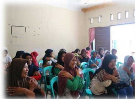
Gambar 3. Pelaksanaan PKM Senam RAS di Desa Kohod