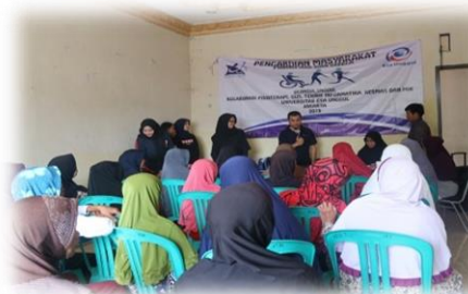
Gambar 2. Pemberian Materi oleh Tim Pengabdian Masyarakat