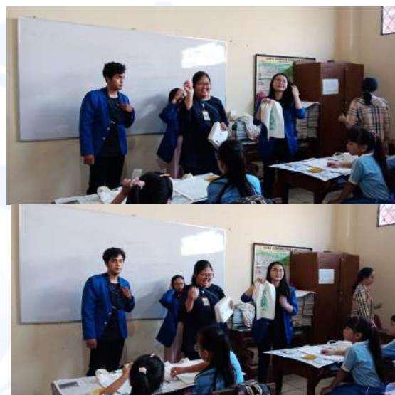
Gambar 8. Pengenalan Bahan Material Sampah Karet (Silicon) dan Contoh Karya Untuk Pelatihan