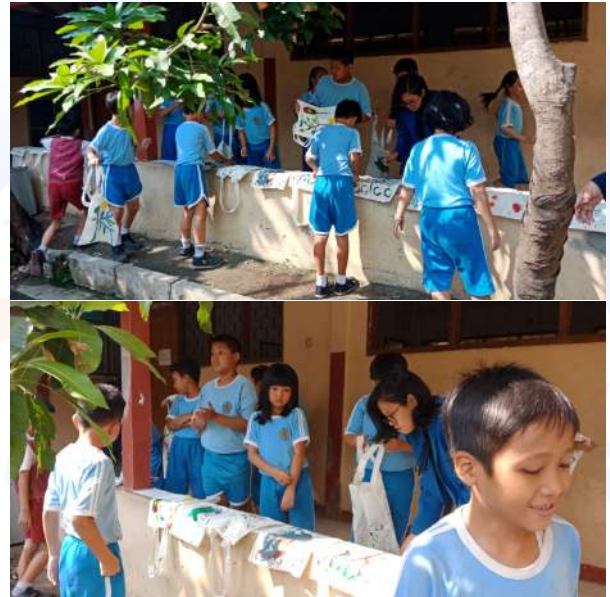
Gambar 11. Para Siswa Menjemur Hasil Karya