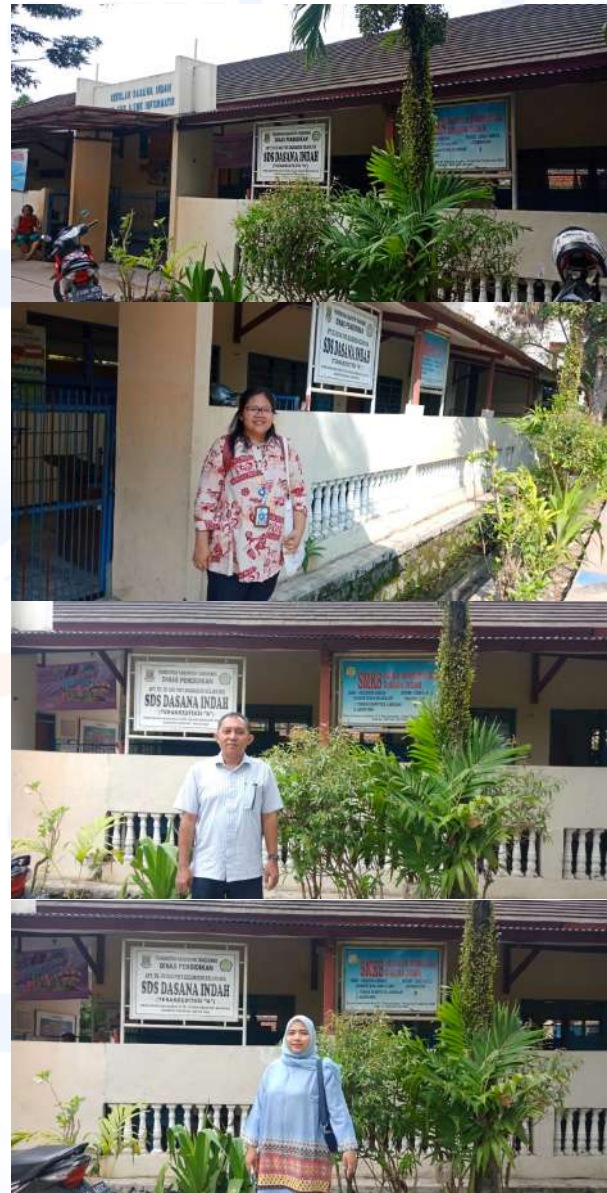
Gambar 4. Tim Melakukan Survei Awal ke SDS Dasana Indah

material dilakukan dengan melatih anak merasakan secara inderawi material maupun peralatan yang digunakan selama proses pelatihan. Dari sini akan dijelaskan tahap per tahap hingga anak nantinya dapat melakukan proses kreativitas sesuai dengan usianya, seperti menghias maupun menggambar tas blacu tersebut agar nampak terlihat indah dan estetika dengan pola-pola dan motif yang dibentuk. Adapun peralatan yang akan digunakan diantaranya: potongan sampah karet silikon dalam ukuran kecil, kain blacu dengan motif binatang, kuas, dan cat akrilik.