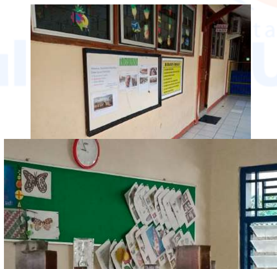
Gambar 3. Karya Seni Rupa Siswa SDS Dasana Indah Dipajang Pada Dinding Dan Jendela Gedung Sekolah Menggunakan Media Kertas

Indah dalam proses kreativitas yang terbatas pada media cetak ini membuat tim pengabdian kepada masyarakat berpotensi melakukan sebuah pelatihan berupa aplikasi warna produk kreatif menggunakan teknik cap. Pelatihan ini tidak hanya mengenalkan teknik cap pada siswa SDS Dasana Indah tapi juga pengenalan warna melalui beberapa peralatan yang digunakan. Salah satunya adalah menggunakan sampah karet.