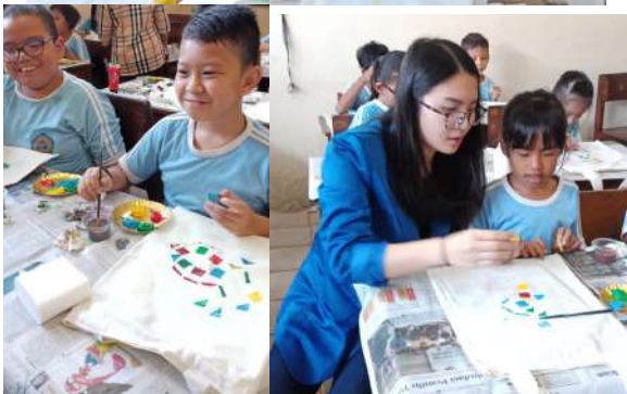
Gambar 10. Siswa SDS Dasana Indah Melakukan Teknik Cap Pada Blacu