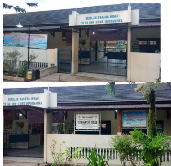
Gambar 2. Tampak Depan SDS Dasana Indah

6.2505347,106.5979242,15z/data=!4m2!3m1!1s0x0:0x19d6cdac51c41b2d?sa=X&ved=2ahUKEwjcrOjd9unhAhUh6XMBHfp5AqQQ_BIwCnoECA0QCA , diunduh tanggal 25 April 2019 jam 06.55 WIB