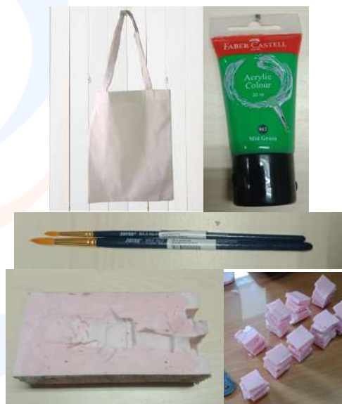
Gambar 6. Persiapan Peralatan dan Material untuk Pelatihan

Dalam melakukan kegiatan pelaksanaan pengabdian kepada masyarakat berupa pelatihan pengaplikasian warna dengan memanfaatkan sampah karet menggunakan teknik cap pada tas blacu ini, tim harus mempersiapkan beberapa peralatan yang akan digunakan. Adapun alat yang digunakan dalam pelatihan ini adalah (1) tas blacu polos warna putih; (2) cat akrilik; (3) kuas lukis; dan (4) sampah karet silikon yang tidak terpakai dan akan dipotong menjadi bagian kecil sebagai alas untuk melakukan teknik cap pada blacu. Kemudian tim pengabdian kepada masyarakat ini membuat pola-pola binatang yang lucu untuk siswa SDS Dasana Indah agar dapat memudahkan melakukan teknik cap pada tas blacu polos