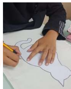
Gambar 7. Menjiplak Pola Gambar pada Tas Blacu