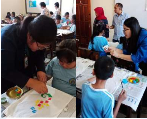
Gambar 9. Dosen dan Mahasiswa FDIK Memberikan Contoh Pengerjaan Kepada Siswa