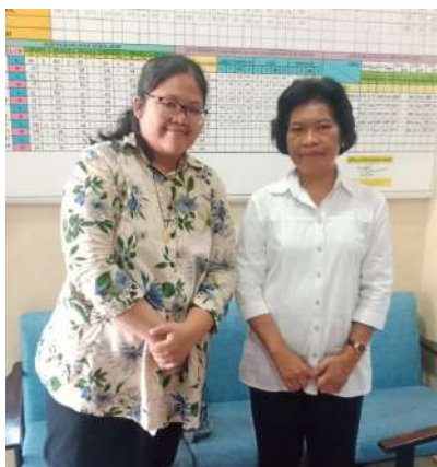
Gambar 5. Pertemuan dengan Kepala Sekolah SDS Dasana Indah

‘Dalam pelaksana kegiatan pengabdian kepada masyarakat untuk siswa SD Dasana Indah, ketua dan tim pelaksana tidak sendirian. Mereka didampingi oleh para pengajar dan guru masing-masing sesuai dengan kelasnya sesuai dengan jadwal yang telah ditentukan antara ketua pelaksana pengabdian kepada masyarakat dengan Kepala Sekolah SDS Dasana Indah melalui surat menyurat yang dilakukan sebelum acara berlangsung. Setelah pelatihan selesai diadakan evaluasi pelaksanaan program baik secara internal (ketua dan tim) maupun eksternal (dengan mitra) agar nantinya kedepan tetap ada keberlanjutan program setelah selesai kegiatan pengabdian kepada masyarakat dilaksanakan.