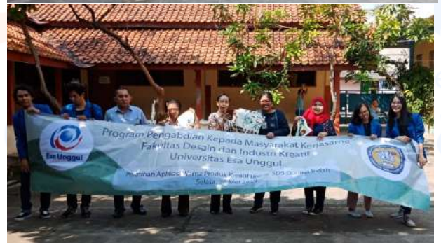
Gambar 12. Foto Bersama dengan Para Guru dan Siswa SDS Dasana Indah