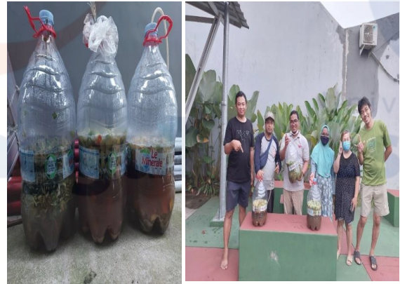
Gambar 3. Sesi akhir kegiatan abdimas (A) fermentasi eco-enzyme, (B) foto bersama