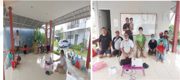
Gambar 1. Penyampaian materi tentang eco enzyme kepada peserta.

pemberdayaan masyarakat dalam mengelola sampah agar menjadi produk yang bermanfaat salah satunya adalah eco-enzyme