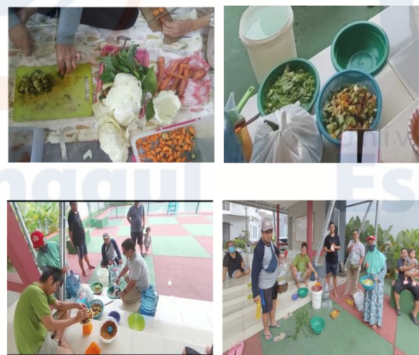
Gambar 4. Praktek pembuatan eco-enzyme oleh peserta

Dengan adanya kegiatan ini mereka jadi tahu bagaimana cara pemanfaatan limbah organik rumah tangga, bahkan dapat dijadikan produk yang dapat di jual (komersil). Karena produk eco-enzyme ini di situs penjualan online harga per lima liter di bandrol dengan harga Rp. 125.000,'. Di beberapa e commerce seperti Shopee harga per 200 ml di kisaran harga Rp. Rp.35.000 – Rp 70.000. Dengan hal ini, tentu menjadi peluang bisnis usaha dalam skala rumah tangga jika ditekuni dengan baik. Cairan eco-enzyme sendiri banyak manfaat terutama untuk kebutuhan rumah tangga diantaranya sebagai karbol alami, desinfektan, cairan antiseptik, pestisida alami, penyubur rambut, pupuk cair organik dan lain – lain. Dengan banyaknya fungsi dari eco-enzyme sehingga menjadi produk yang bernilai ekonomis. Selama kegiatan berlangsung, para peserta sangat aktif bertanya baik secara teoritis maupun dalam melaksanakan praktek. Pada sesi akhir peserta diminta untuk mengisi kuisisioner untuk melihat feedback dari peserta sebagai bahan evaluasi dan gambaran jenis pelatihan yang diinginkan oleh peserta serta melihat tingkat kepuasan dari peserta dalam pelaksanaan kegiatan ini