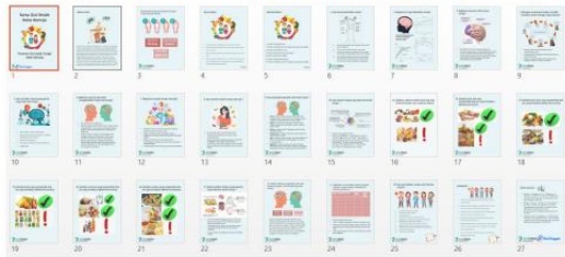
Gambar 1: Media Kartu Edukasi "Peranan Gizi pada Fungsi Otak Remaja"

pre-test dan post-test. Penilaian tingkat keberhasilan program dilakukan dengan mengkategorikan nilai hasil pre-test dan post-test, kategori yang diberikan yaitu tingkat pengetahuan rendah dengan nilai \leq 60 , tingkat pengetahuan sedang dengan nilai 61-80, dan tingkat pengetahuan baik dengan nilai > 80 .