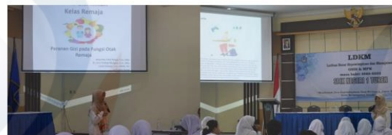
Gambar 1: Pelaksanaan Program Tripilar Anak Berdaya

Pemberian materi dalam pelaksanaan program Tripilar Anak Berdaya menggunakan metode ceramah dengan bantuan media permainan kartu edukasi gizi dan alat peraga berupa tanaman hidup dan mati. Pemberian edukasi gizi dengan metode ceramah telah terbukti mampu meningkatkan tingkat pengetahuan, penelitian pada siswa SMA di Makassar menunjukkan bahwa siswa mengalami peningkatan pengetahuan mengenai gizi seimbang sebanyak lebih dari 50% (60%) dalam kategori baik menggunakan kombinasi metode ceramah dengan media powerpoint, demonstrasi dan diskusi (Citrakesumasari et al., 2019; D. Wang et al., 2015). Penggunaan metode ceramah dengan menggunakan slide dapat meningkatkan pengetahuan karena adanya komunikasi dua arah, dan dalam metode ini dapat membahas materi secara mendalam (Safitri & Fitranti, 2016). Kombinasi metode ceramah dan demonstrasi dengan diskusi merupakan penggabungan metode yang sesuai, karena edukasi dengan metode diskusi dapat melibatkan siswa secara aktif untuk berpendapat dan menyampaikan