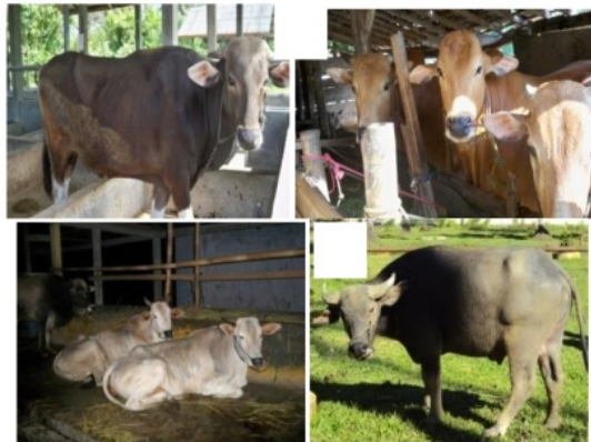
Gambar 1 Sapi bali (A), sapi madura (B), sapi PO (C) dan kerbau (D).

Daging mentah dari kerbau dan sapi lokal mengandung vitamin B 1 , B 6 dan vitamin E yang mirip dengan sapi Nebraska cross-bred . (gambar 2). Daging dari sapi Nebraska cross-bred . bersumber dari the Animal Science Department, University of Nebraska-Lincoln yaitu sapi pedaging yang diberi pakan mengandung 0% atau 40% WDGS ( Wet distiller's grain plus soluble ) dengan dan tanpa ditambah vitamin E (500 IU/hari) selama 140 hari di the University of