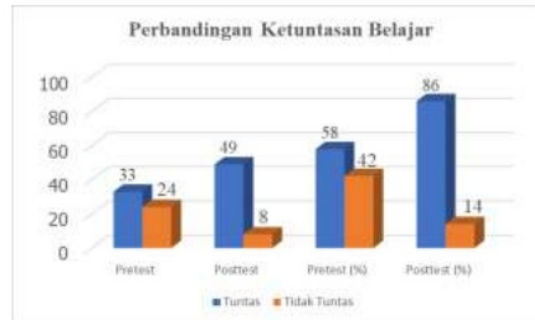
Gambar 2. Perbandingan Ketuntasan Belajar

Modul yang dibuat telah diujicobakan dalam pembelajaran dan hasil belajar yang diperoleh dapat menunjukkan tingkat keefektifan produk. Untuk mengukur ketercapaian kompetensi dasar dan indicator terhadap pembelajaran telah dilakukan tes hasil belajar dengan erolehan rata-rata hasil belajar dengan melihat capaian hasil belajar dengan KKM dari mata kuliah yang telah ditentukan yakni 75. Hasil perbandingan ketuntasan belajar mahasiswa sebelum dan sesudah menggunakan modul dapat dilihat dari tabel berikut,