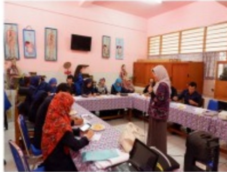
Foto 2. Penulhan dan Pematari