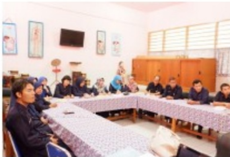
Foto 3. Guru menyimak Penyuluhan