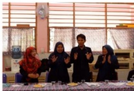
Foto 4. Tampilan game kelompok