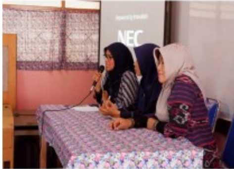
Foto 1. Pembukaan dan Penyuluhan