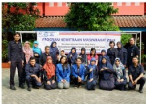
Foto 5. Foto Tim dan Peserta Mitra