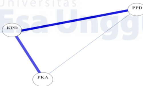
Gambar 2. Analisis jaringan (network) variabel kompetensi pedagogik, pengetahuan pedagogik, dan profil karakteristik awal

Pada tabel 4 menunjukkan analisis jaringan jalan variabel yang saling terikat melihat suatu gambaran interaksi dan hubungan yang selalu terjadi antara variabel kompetensi pedagogik, pengetahuan pedagogik dan profil karakteristik awal dalam suatu kondisi dalam diri guru. Berdasarkan data menunjukkan keterkaitan antara variabel pengetahuan pedagogik dan profil karakteristik awal terhadap kompetensi pedagogik memiliki kesaamaan sebesar -0,577. Kemudian secara kedekatan ( closeness ) profil karakteristik awal memiliki hubungan yang lebih dekat dengan kompetensi pedagogik sebesar -0,723 sedangkan pengetahuan pedagogik memiliki kedekatan hubungan sebesar -0,418. Kemudian berdasarkan kekuatan jaringan ( strength ) menunjukkan bahwa profil karakteristik awal memiliki keterkaitan lebih kuat dengan kompetensi pedagogik sebesar -0,799 sedangkan pengetahuan pedagogik memiliki kekuatan jaringan sebesar -0,323. Selanjutnya visualisasi dari analisis jaringan ke tiga variabel disajikan pada gambar berikut.