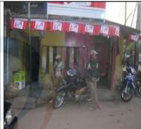
Foto 7. Selepas menjual tanah pertanian kepada BSD, komuniti asal bekerja sebagai tukang 'ojek' (taxi motor)