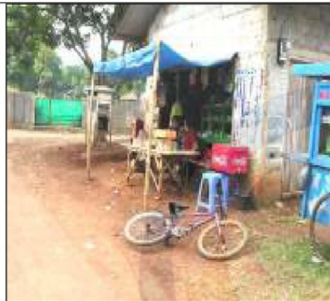
Foto 6. Selepas menjual tanah pertanian kepada BSD, komuniti asal berniaga kecil-kecilan di depan rumah mereka