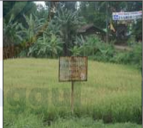
Foto 3. Tanah komuniti asal yang sudah dikuasai pemaju BSD