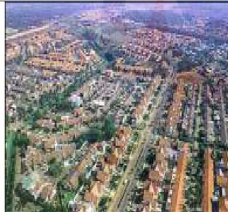
Foto 2. Kawasan perumahan Bandar Baru BSD

Matlamat asas pembangunan yang dinyatakan sebagai membudayakan manusia sebagai insan yang merdeka dalam upaya mencapai taraf kehidupan yang lebih baik dan berkeadilan nampaknya tidak dapat dinikmati oleh penduduk asal. Bahkan pelbagai ketidakadilan telah menimpa mereka. Ketentuan yang terdapat dalam Undang Undang Nombor 24 Tahun 1992 (Undang-Undang Tata Ruang) yang menyatakan bahawa setiap kegiatan yang merubah landskap kawasan seharusnya boleh memberikan kemanfaatan bagi seluruh masyarakat belum diamalkan sepenuhnya dalam konteks pembangunan Bandar Baru BSD, dan ini ternyata dari peminggiran ruang lingkup penduduk asalnya. Secara yang adil sepatutnya adalah membuat bandar baru yang tidak meminggirkan dan tidak merugikan penduduk asal dan tentunya ini harus mempunyai agenda ekonominya sendiri seperti merancang bandar perindustrian yang berasaskan pertanian.