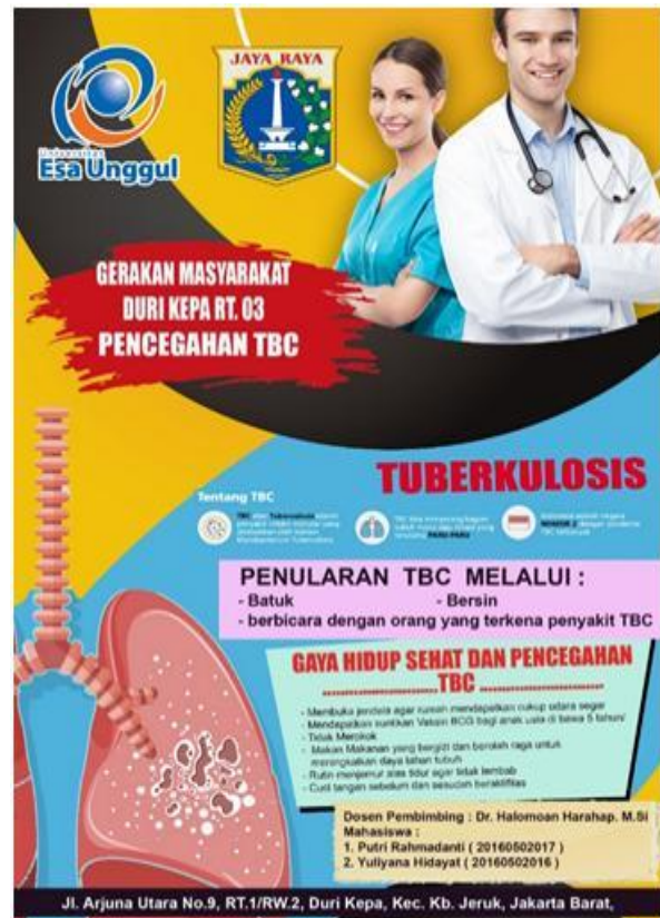
Gambar 2 Contoh poster