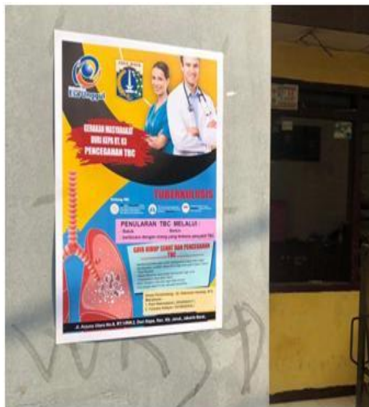
Figure 6 Poster ditempel di tembok

Selama pelaksanaan kampanye dilakukan pemantauan (monitoring). Waktu pelaksanaan kampanye selama bulan Agustus 2019. Beberapa hari petugas ke lapangan untuk menyuluh warga. Waktunya cukup tepat, karena masyarakat di Kebon Jeruk selalu saja ada di rumah.