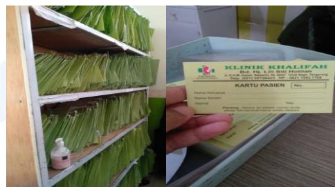
Gambar 2. Sistem Penyimpanan dan Kartu Pasien di Klinik Khalifah

Menurut Harjanti, sistem penyimpanan menggunakan family folder memiliki kelebihan diantaranya tempat penyimpanan/rak penyimpanan lebih hemat disesuaikan dengan jumlah kunjungan, kemudahan pengambilan dan pengembalian rekam medis, serta kemudahan akses dalam mengakses dokumen berbasis keluarga sedangkan kelemahan yang terjadi adalah waktu pendaftaran lebih lama jika terjadi pisah Kepala Keluarga atau pindah tempat tinggal. Petugas harus melakukan registrasi baru atau pemberian nomor rekam medis baru jika pasien melakukan pemindahan kartu keluarga (Harjanti & Wariyanti, 2020).