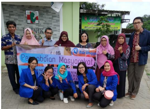
Gambar 8 Dokumentasi Kegiatan Pengabdian Masyarakat bersama Mahasiswa