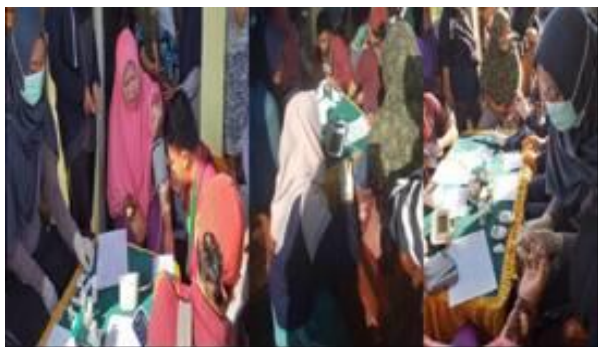
Gambar 2 Pemeriksaan Kesehatan di Desa Lumbang, Kabupaten Sambas

Pemeriksaan kesehatan (Pengukuran tensi) dan konsultasi masalah kesehatan pada masyarakat di Balai Desa Lumbang dilaksanakan pada tanggal 16 Maret 2019. Kegiatan ini dihadiri sebanyak 40 orang warga dimana mayoritas yang hadir adalah perempuan sebanyak 33 orang (82,5%) dengan rata-rata umur mereka berkisar kurang lebih 48 tahun. Alur pelayanan kegiatan ini dimulai yaitu warga yang datang harus melakukan registrasi terlebih dahulu di bagian pendaftaran, kemudian dilakukan pemeriksaan kesehatan berupa pengukuran tensi dan konsultasi masalah kesehatan oleh petugas kesehatan dan dibantu oleh kader kesehatan serta mahasiswa. Hasil pemeriksaan dinyatakan mayoritas masyarakat di Desa Lumbang memiliki tekanan darah jauh di atas normal yaitu sebanyak 35 orang (87,5%), beberapa diantaranya mayoritas memiliki riwayat penyakit hipertensi dan Diabetes Melitus.