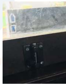
Gambar6. Slot pengunci bahan stainless steel

Masalah lain yang timbul diluar rencana adalah slot pengunci jendela yang rusak karena proses pengkaratan disebabkan udara yang bercampur dengan air laut. Tim PKM melakukan penggantian kepada semua slot pengunci dengan mengganti dengan bahan yang anti karat. Hal ini merupakan salah satu luaran yang bisa dikatakan merupakan teknologi tepat guna.