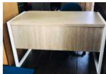
Gambar7. Meja dengan kaki yang kokoh

Teknologi tepat guna juga diaplikasikan pada Permasalahan perabot yang sudah rusak, diganti dengan perabot yang lebih tahan lama akibat cuaca yang ada di Pulau Untung Jawa.