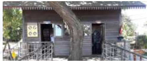
Gambar1. Ruang Publik Terpadu Ramah Anak P. Untung Jawa

RPTRA, yang diinisiasi oleh Pemprov DKI Jakarta di bawah kepemimpinan Mantan Gubernur DKI Jakarta Basuki Tjahaja Purnama dibangun sebagian besarnya dengan menggunakan sumbangan dana Corporate Social Responsibility . Peran pemprov biasanya dengan menyediakan lahan. Biaya pembangunan biasanya berkisar 400-750 juta dari pihak swasta. Proses pembangunan, pengawasan, dan pemeliharaan RPTRA juga melibatkan masyarakat sekitar. Bahkan perawatan taman juga dilakukan oleh masyarakat di sekitar RPTRA dan dikoordinir oleh ibu-ibu PKK. Harapannya, RPTRA bisa ikut membantu kota DKI Jakarta untuk bisa meraih status kota layak anak sekaligus menyediakan ruang terbuka hijau bagi publik. (Wikipedia, 2018). RPTRA juga berkembang dibangun sampai pada kecamatan kepulauan seribu, yang salah satunya berada di kelurahan Pulau Untung Jawa