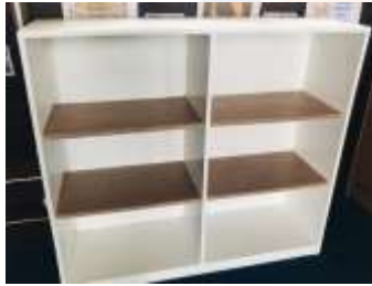
Gambar8. Lemari buku dengan pelapis cat duco