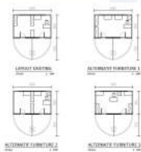
Gambar3. Alternatif Layout Ruang Dalam