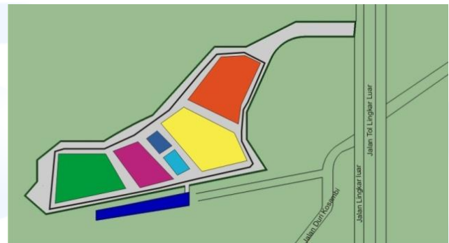
Gambar 3. Rencana Blok

Keterkaitan antara moda seperti bus AKAP dengan bus dalam kota memiliki keterkaitan sangat dekat. Oleh karena itu, letaknya tidak jauh agar nanti mempermudah para penumpang angkutan dalam melakukan pertukaran moda dengan aman, nyaman, dan efisien. Berikut adalah gambar rencana blok: