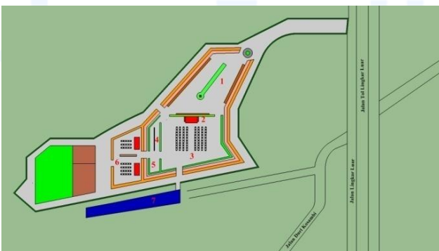
Gambar 4 Ilustrasi Siteplan