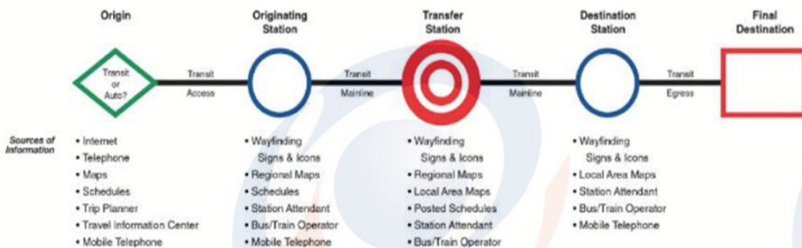
Gambar 1 Konsep Konektivitas

Menurut teori graf (Harary, 1971, dalam S.Mishra, 2012) konektivitas dapat didefinisikan menjadi sebagai tingkat dimana titik atau node dalam jaringan (dalam hal ini jaringan transportasi/jalan) saling terhubung satu sama lain. Konektivitas dapat didefinisikan sebagai seberapa banyak jalan raya saling berpotongan dan seberapa jarak ruang atau spasi yang ada di dekat persimpangan. Pola jalan grid biasanya memiliki konektivitas yang lebih besar dibandingkan dengan jalan-jalan yang melengkung atau bersifat cul-de-cacs (Turley, B.m, 2008). Konektivitas dalam konteks perencanaan transportasi, mengacu pada kemudahan, waktu atau biaya perjalanan antar sistem rute transportasi yang berbeda atau sistem modal. Penggunaan konektivitas yang paling umum adalah dalam hal konektivitas jalan lokal untuk jalur akses multi-modal yang spesifik, seperti: (1) akses jalan ke sistem jalan tol (bebas hambatan); (2) stasiun angkutan umum lokal; (3) terminal kereta api; (4) bandara; (5) pelabuhan laut; (6) pelabuhan internasional atau; (g) penyebrangan. Satu sama bisa menentukan langkah-langkah dari konektivitas pengumpan transit, kereta api atau udara ke jarak terdekat. Dalam artian yang lebih ringkas, konektivitas merupakan bentuk akses yang ada diantara dua sistem (Alstadt, Wisbrod, dan Cutler, 2011).