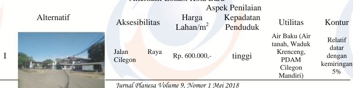
Tabel 1 Alternatif Lokasi Kota Baru

Di Kecamatan Citangkil terdapat 3 alternatif lokasi yang memungkinkan direncanakan sebagai kota baru, aspek yang dinilai sesuai dengan Standar Pelayanan Minimal Sebuah Kota, adapun aspek penilaian adalah sebagai berikut: