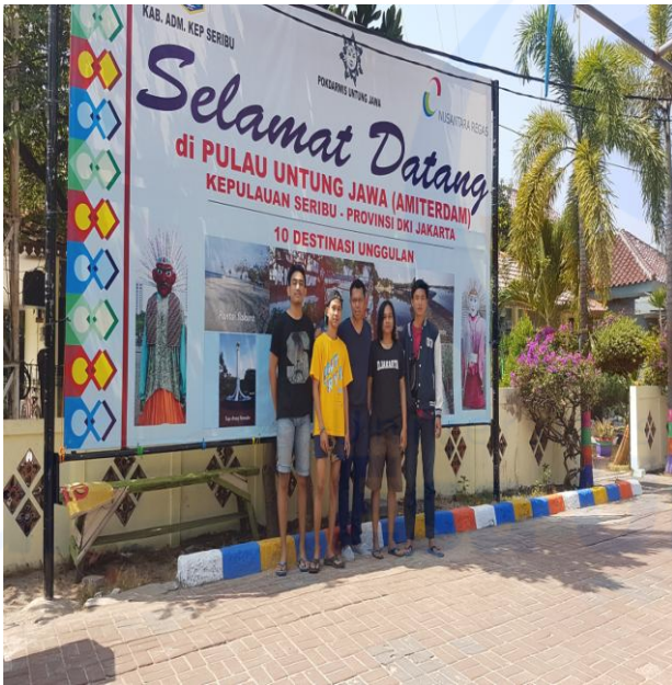
Gambar 2

Penulis dalam Pengabdian Kepada Masyarakat di Pulau Untung Jawa