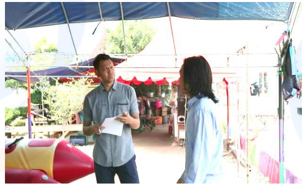
Gambar 3

Analisis awal di paparkan secara deskripsi pada masing-masing obyek melalui pengamatan intensif dengan bantuan dokumentasi berdasarkan kategori yang sudah ditentukan sebelumnya. Penarikan dalam kesimpulan berupa deskripsi dari hasil analisis yang akan menjawab perumusan masalah penelitian ini.