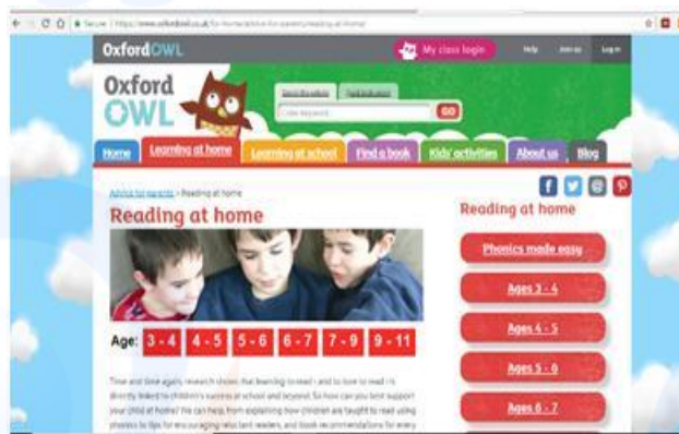
Gambar 2 Tampilan Oxford Owl Reading