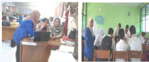
Gambar 5 Aktivitas mengakses dan mengunduh sumber bacaan

Setelah Guru SMPN 220 dan siswa SMPN 274 kelas 7 memiliki pengetahuan dan keterampilan dalam mengakses, mengunduh dan menyimpan buku bacaan dari sumber belajar yang berbasis website, tim pengabdian kepada masyarakat melakukan brainstorming dengan menanyakan kepada partisipan mengenai strategi membaca yang mereka ketahui. Jawaban partisipan sangat bervariasi. Kemudian tim pengabdian kepada masyarakat memaparkan strategi membaca ( choral reading dan theater reading ) kepada mereka di hari keempat. Mereka diberikan kesempatan untuk mendemonstrasikan strategi membaca tersebut dalam kelompok dengan menggunakan buku bacaan yang sudah mereka unggah di minggu sebelumnya.