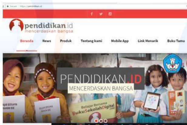
Gambar 1 Tampilan Pendidikan.ID

Guru-guru SMPN 220 dan siswa kelas 7 SMPN 274 belum pernah mengetahui sumber belajar yang berbasis web yang dipaparkan kepada mereka seperti pendidikan id, oxford owl reading dan national geographic . Mereka mengatakan bahwa sumber belajar tersebut sangat baru bagi mereka. Guru-guru SMPN 220 sangat antusias dalam mengeksplorasi sumber bacaan dari sumber belajar berbasis web tersebut. Mereka mengatakan bahwa sumber bacaan menarik karena berbentuk komik dan audio serta bervariasi sehingga siswa memiliki kesempatan untuk memilih sumber bacaan sesuai dengan ketertarikan mereka. Tidak hanya guru-guru SMPN 220 saja yang antusias, siswa kelas 7 SMPN 274 juga sangat senang menggunakan sumber bacaan tersebut. Mereka mengungkapkan alasan yang sama seperti guru-guru SMPN 220.