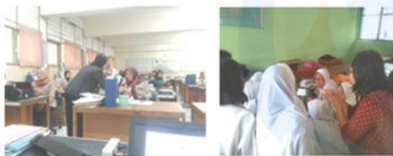
Gambar 4 Sosialisasi literasi secara umum

manfaat dan makna gerakan literasi tersebut secara berkelompok.