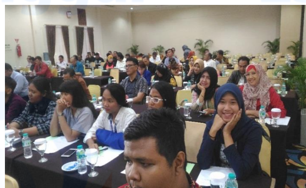
Gambar 1 Kegiatan Sosialisasi dan Penyuluhan Koperasi di Hotel Sentral Jakarta

Langkah berikut, masing-masing adalah sosialisasi, rapat pendirian dan penanda tanganan akta pendirian koperasi. Sesuai dengan regulasi koperasi bahwa apabila anggota koperasi berasal lebih dari atau minimal 3 provinsi, maka sosialisasi dapat dilakukan oleh Kementerian Koperasi Usaha Kecil dan Mengnegah, kegiatan sosialisasi dilaksanakan pada tanggal 21 November 2018 di Hotel Sentral Jakarta Timur. Berikut foto kegiatan sosialisasi.