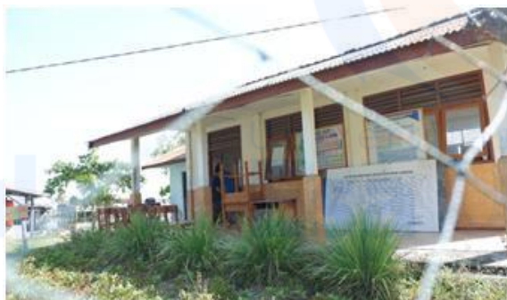
Gambar 1 Keadaan perpustakaan sekolah

Melihat permasalahan yang terdapat di wilayah tersebut maka pengabdian masyarakat ini dirancang mengikuti agenda kegiatan KKN Tematik Merajut Nusantara Tahun 2018 di bawah naungan Kopertis III DKI Jakarta.