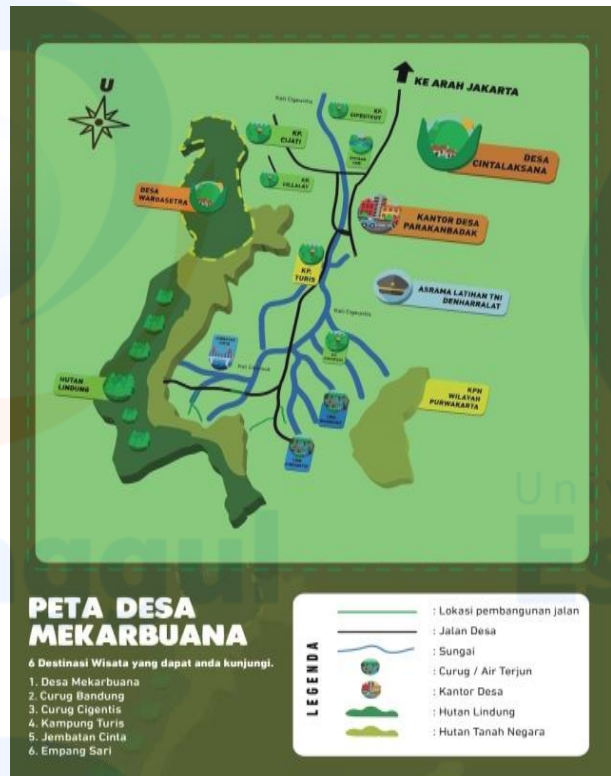
Gambar 4 Peta destinasi wisata Desa Mekarbuana