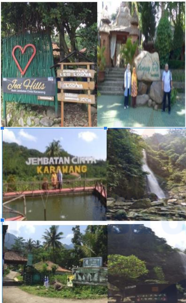
Gambar 2. Lokasi Wisata Desa Mekarbuana