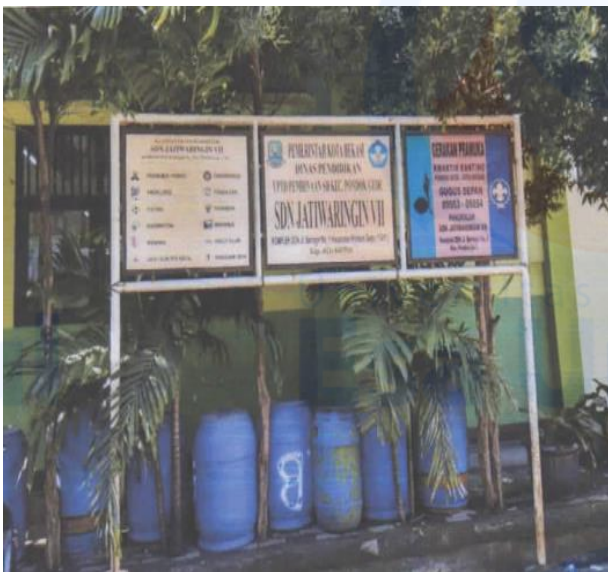
Gambar 2 Profile SDN Jatiwaringin X

Gambaran foto SDN Jatiwaringin X dapat dilihat pada Gambar 2.