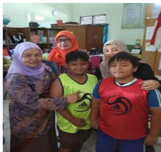
Gambar 6 Pemberian rompi bola