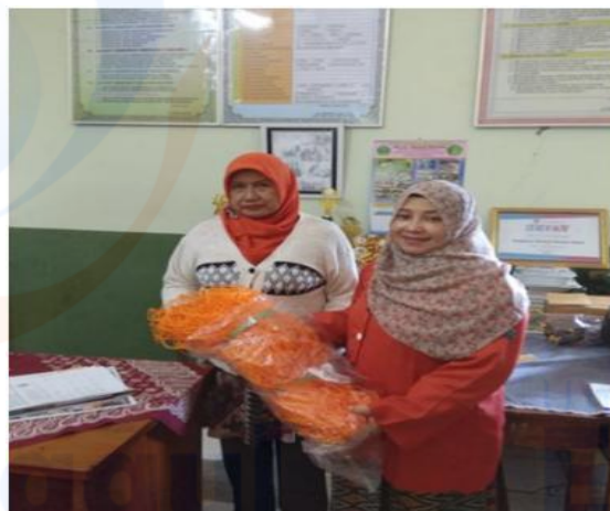
Gambar 5 Pemberian Jaring sepak bola