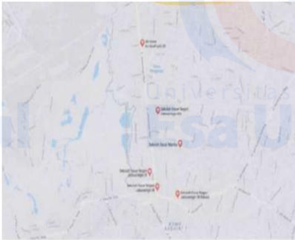
Gambar 1. Peta lokasi SDN Jatiwaringin X

dilakukan agar menambah semangat para peserta didik di SDN Jatiwaringin X sehingga mampu bersaing dengan sekolah lainnya. Adapun gambaran peta lokasi SDN Jatiwaringin X dapat dilihat pada Gambar 1.