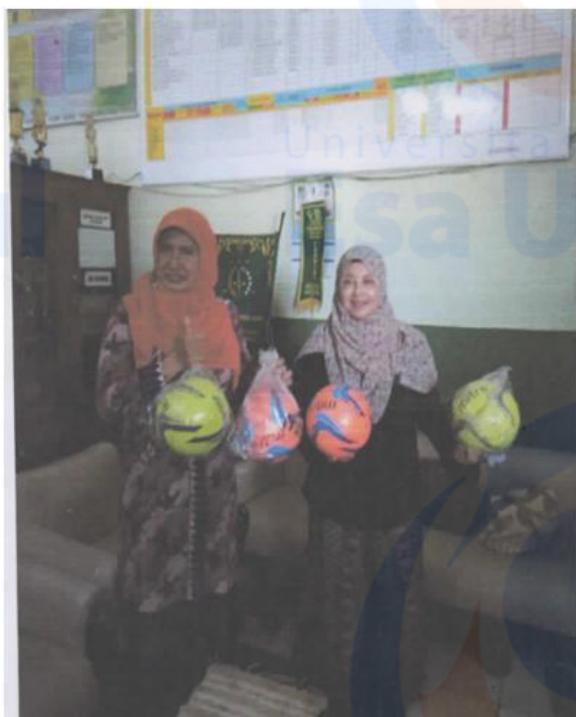
Gambar 4. Pemberian bola

Kegiatan Olahraga dapat terwujud apabila tersedia fasilitas yang diperlukan, tetapi berdasarkan hasil pengamatan yang sudah dilakukan, pihak sekolah belum memiliki fasilitas tersebut sehingga dilakukan kegiatan pemberian alat-alat Olah Raga yang dilakukan pada Semester Ganjil tahun akademik 2017/2018 sampai Semester Ganjil tahun akademik 2018/2019. Hal ini dilakukan karena atas permintaan dari sekolah (SDN Jatiwaringin X) yang merasa sangat terbantu dengan adanya fasilitas yang diberikan. Adapun foto-foto kegiatan yang dilakukan, dapat dilihat pada Gambar 4-6