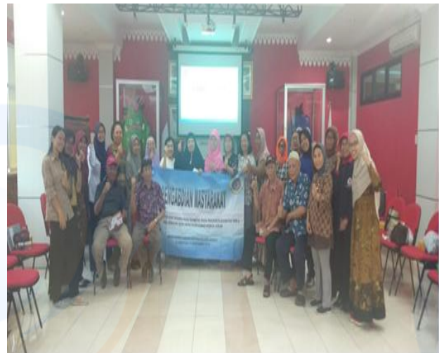
Gambar 4. Bersama Peserta Pengabdian Masyarakat

Hasil pemeriksaan dari 10 titik pada punggung dan telapak kaki ditemukan 14 orang (71,27%) dari 25 peserta, hal tersebut menunjukkan angka yang tinggi dan sudah terjadi penurunan sensasi pada kaki peserta prolanis. Sedangkan untuk tekanan darah dan gula darah rata-rata 126 gr/dl. Kader yang terlibat di evaluasi dapat melakukan cara pemeriksaan kaki diabetik kepada peserta prolanis. Peserta prolanis yang mengalami resiko tinggi neuropati di tindak lanjuti dengan pemberian penyuluhan mengenai perawatan kaki diabetik. Ditambahkan oleh hasil pengabdian masyarakat Istanah dkk (2019) terdapat gambaran peserta prolanis yang mengalami neuropati sensori dan peningkatan pengetahuan peserta prolanis tentang pemeriksaan kaki diabetik. Sejalan dengan penelitian yang dilakukan oleh Safitri et al. (2018), mengatakan bahwa lama riwayat DM paling banyak berada pada rentang 5-10 tahun semakin lama seseorang menderita DM maka semakin besar resiko untuk menderita komplikasi diabetes. Ditambahkan oleh penelitian Priyanto (2005), menyatakan bahwa factor resiko signifikan untuk perkembangan