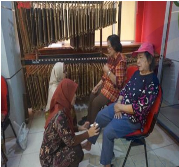
Gambar 3. Penjelasan Manfaat Pemeriksaan Monofilament