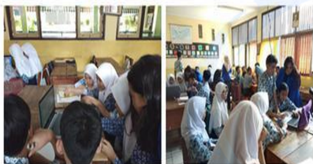
Gambar 6 Siswa diberikan pendampingan oleh Tim Abdimas UEU

Siswa diberikan kesempatan berdiskusi dalam kelompok untuk membuat cerita mereka sendiri dan menentukan karakter serta alur yang akan dibuat. Siswa didampingi oleh tim pengabdian kepada masyarakat Universitas Esa Unggul.