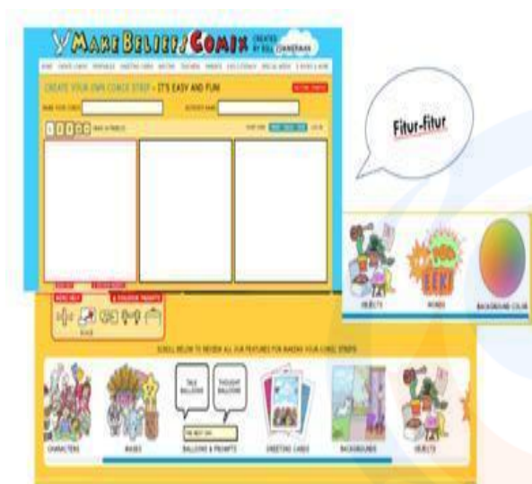
Gambar 5 Fitur dan fungsi make beliefs comic

Terdapat fitur character , masks , balloons , background , background color , object dan words . Untuk memilih tokoh atau karakter siswa dapat memilih di fitur character . Jika mereka ingin menambahkan topeng, mereka dapat memilih masks . Untuk menuliskan teks mereka dapat memilih balloons dan untuk memberikan latar belakang pada komik dengan memilih background . Latar belakang komik dapat ubah-ubah warnanya dengan menggunakan background color . Untuk menambahkan obyek seperti permen, kursi atau obyek lainnya dapat menggunakan fitur object . Fitur word dapat digunakan oleh siswa jika ingin menampilkan kata yang ukurannya besar dan bentuk yang unik.