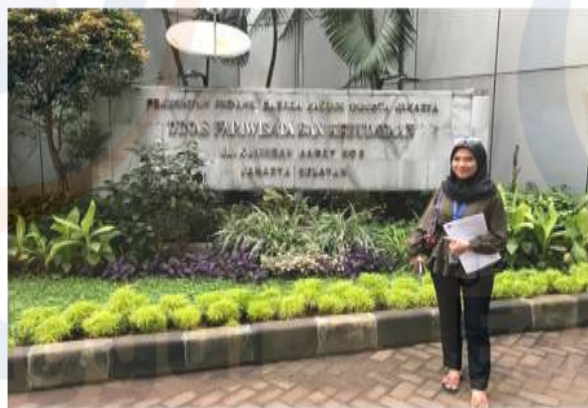
Gambar 2 Halaman Dinas Pariwisata dan Ekonomi Kreatif DKI Jakarta

Dari uraian keadaan lingkungan terkait destinasi wisata baik alam maupun indoor/dalam wilayah tertentu, kuliner, akses fasilitas umum, peta wilayah, bantuan informasi, tempat bersejarah, dan hal lainnya terkait pariwisata dan ekonomi kreatif dapat di lihat menjadi lebih menarik terkait hal tersebut di atas, Universitas Esa Unggul melalui Fakultas Ilmu Komunikasi mengadakan program pengabdian pada masyarakat melalui pemodelan majalah yang nantinya akan menjadi bagian dari kegiatan edukasi dan pariwisata di DKI Jakarta, yang dalam lingkup sosial dapat menggambarkan heterogenya suku, agama, ras yang berdomisili di DKI Jakarta dengan sajian beragam kuliner khas daerah, dan tentu menggambarkan kehidupan alkulturasi budaya dengan beragam profesi dan kesehariannya yang saling bersahaja.