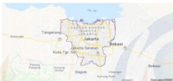
Gambar 1 Peta DKI Jakarta

Dinas Pariwisata dan Ekonomi Kreatif Provinsi DKI Jakarta saat ini telah memiliki ruang informasi baik cetak maupun digital, namun dari segi penyajian masih di rasa perlu sentuhan komunikasi dan desain yang lebih menarik dalam medianya, sehingga kegiatan Pengabdian Pada Masyarakat ini terkait pemodelan majalah internal bidang pariwisata dalam mendukung kegiatan edukasi pariwisata di DKI Jakarta dapat menjadi nilai tambah bagi Dinas Pariwisata dan Ekonomi Kreatif DKI Jakarta untuk meng expose DKI atas segala hal yang menjadi karakter wilayah utamanya dalam tatanan pariwisata dan ekonomi kreatif.