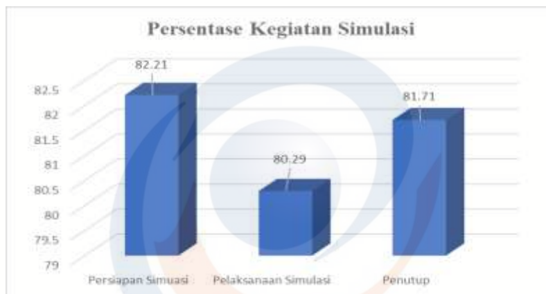
Gambar 2. Grafik Persentase Kegiatan Simulasi

Hal ini menunjukkan bahwa dalam melakukan simulasi RPP yang telah mereka buat, sudah dapat dikatakan konsisten dengan apa yang telah mereka rancang. Hasil ini sudah menggembirakan. Dan diharapkan pada saat mereka sudah menunaikan keprofesiannya calon guru