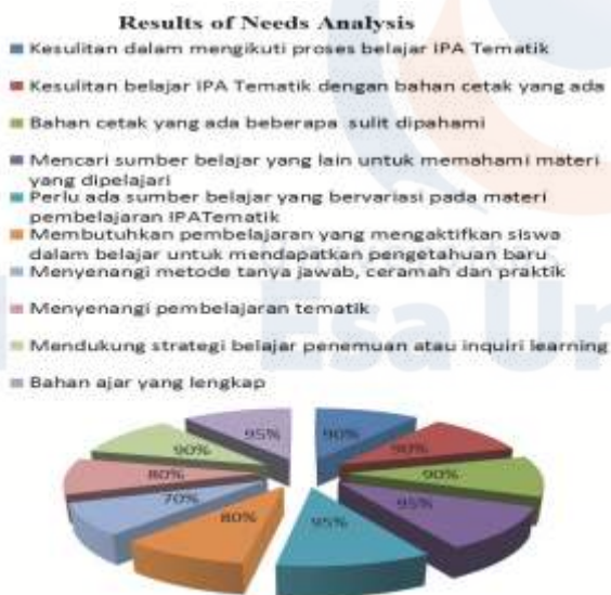
Gambar 1. Hasil Analisis Kebutuhan

Sedangkan (b) Guru: Pendidik atau guru juga menyelenggarakan program pendidikan memiliki pengalaman yang cukup, dan referensi tentang bentuk program pembelajaran yang sesuai untuk siswa / siswa. Wawancara telah dilakukan pada Guru Kelas IV, yang mengajar menggunakan buku tematik Kurikulum 2013. Dia memberikan informasi bahwa buku tematik Kurikulum 2013 telah diterapkan dalam pembelajaran di kelas, tetapi harus diajarkan lebih menarik, tidak membingungkan siswa, dan harus mengaktifkan siswa dalam belajar, sehingga siswa dapat termotivasi dalam belajar, dan bahan ajar dapat mendukung siswa dalam memahami materi yang dipelajari.