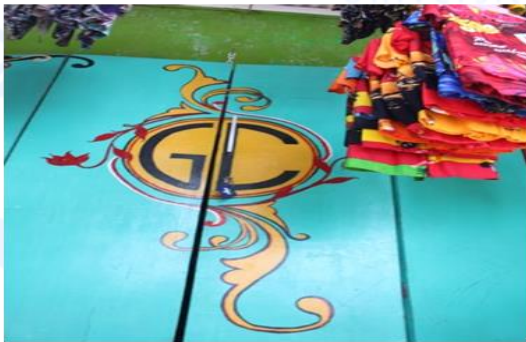
Gambar 4 Logo Awal Gibran Collection dengan Efek Daun

Hal ini akan mengakibatkan hilangnya differensiasi (perbedaan) antara logo perusahaan satu dengan lainnya. Sehingga logo-logo yang ada lebih terkesan mirip atau identik dan tidak kreatif. Kalaupun ada perbedaan, itupun tidak bergeser terlalu jauh.