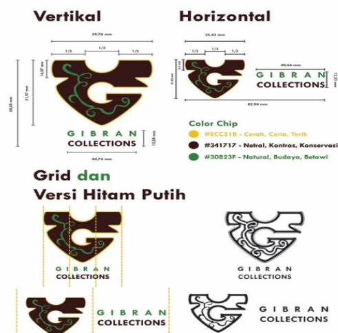
Gambar 6 Grid Pada Logo