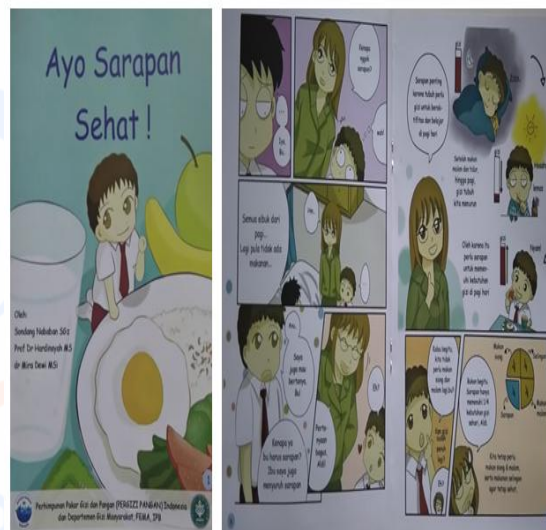
Gambar 1 Komik “Ayo Sarapan Sehat”