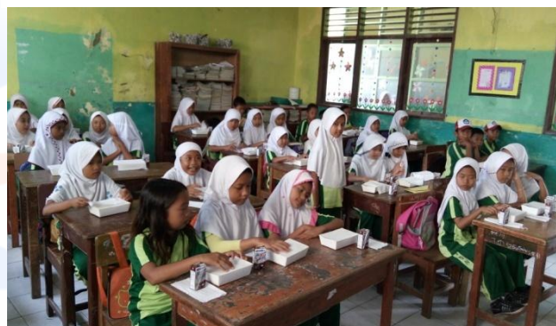
Gambar 4. Suasana Penyuluhan Sarapan Sehat Kepada Anak Sekolah Dasar

antara lain: usia anak, jenis kelamin anak, pengetahuan anak mengenai kesehatan dan gizi, ketersediaan makanan pagi di rumah, waktu tempuh atau jarak antara rumah dengan sekolah, jumlah uang saku, kebiasaan jajan yang mengenyangkan, kebiasaan membawa bekal dari rumah, persepsi tubuh ideal (ingin seperti model), serta pendidikan, pekerjaan, dan penghasilan orang tua.