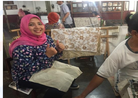
Gambar 1 Proses Pembuatan Pola Pematikan

Apakah desain kemasan batik plentong saat initelah memenuhi unsur standarisasi dan ergonomi bagi konusmen?