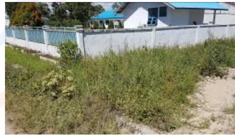
Gambar 4 Tampak depan kanan area