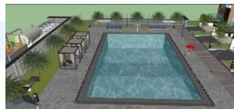
Gambar 10 Kajian Pemodelan