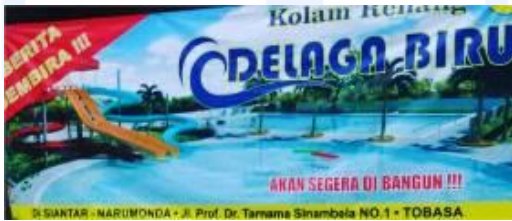
Gambar 1 Spanduk Delaga Biru

Penduduk setempat menyediakan fasilitas wisata seperti : homestay / penginapan dengan variasi harga yang relatif terjangkau, restoran yang menyajikan menu seafood maupun wahana air kolam renang dewasa dan anak, lahan playground anak dan store kelengkapan kolam renang, dan live music konsep yang ditawarkan sehingga membuat lebih menarik dan entertain.