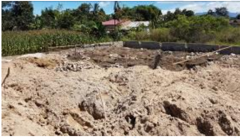
Gambar 8 Tampak belakang daerah Restaurant

Pembahasan dan hasil dari perencanaan yang dilakukan bersama masyarakat setempat dapat disimpulkan bahwa pemahaman akan suatu potensi daerah sangatlah diperlukan. Maka dari itu masyarakat mengangkat suatu lahan potensi pengembangan sektor pariwisata. Mengingat daerah tersebut sangat memiliki potensi pengembangan sektor pariwisatanya maka dipilihlah pengembangan disektor tersebut. Dimulai melakukan pengkajian kebutuhan daerah tersebut, hingga memulai klarifikasi identifikasi masalah yang menjadi landasan pengembangan.