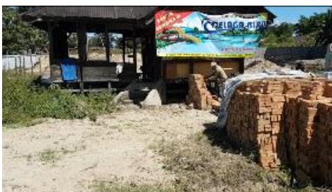
Gambar 3 Tampak Depan Area Parkir

Wilayah sekitar Porsea, Narumonda Kab. Tobasa. Delaga Biru yang berlokasi di Jln Prof. Tarnama Sinambela sebelah Puskesmas Narumonda