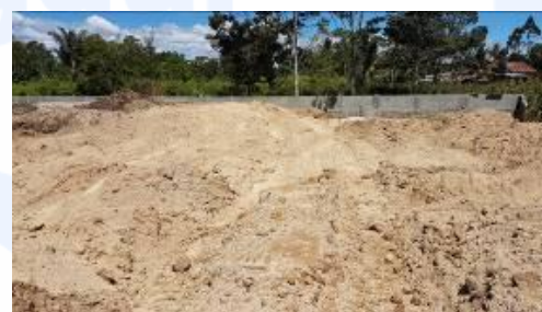
Gambar 7 Tampak belakang daerah kolam renang anak