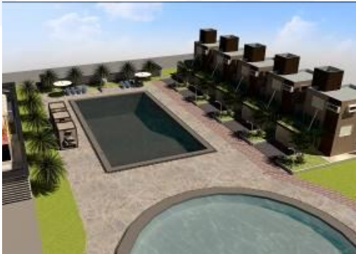
Gambar 13 Kajian Pemodelan