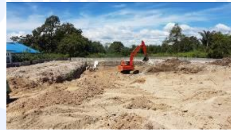
Gambar 5 Tampak Tengah daerah kolam renang dewasa dan anak