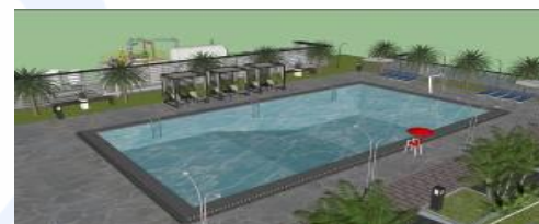
Gambar 11. Kajian Pemodelan Sumber : Jhon Viter M. 2017