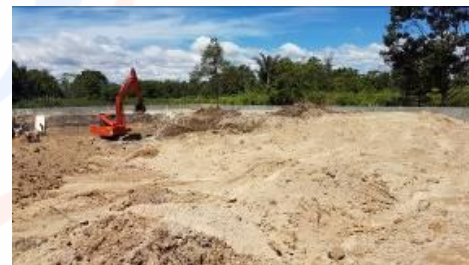
Gambar 6 Tampak kanan daerah kolam renang dewasa dan anak