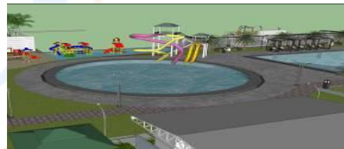
Gambar 9 Kajian Pemodelan

Masyarakat setempat mulai memahami pentingnya penerapan konsep dalam suatu gagasan ide dalam menjawab suatu permasalahan. Dalam hal ini pengembangan sektor pariwisata, pembangunan fasilitas sarana dan prasarana pendukung. Dalam pengembangan gagasan tersebut tim beserta masyarakat setempat menciptakan sebuah gagasan perencanaan pembangunan sebuah fasilitas, hal ini didasari hasil evaluasi kebutuhan didaerah tersebut sehingga tepat guna dan mampu menciptakan peluang pekerjaan yang besar bagi penduduk setempat. Baik pengelolaan sarana tiap divisi serta layanan jasa service produk wisata tersebut. Permasalahan yang dihadapi oleh masyarakat tersebut menghasilkan sebuah pemodelan sarana hiburan bagi masyarakat dideerah Tobasa, Sumatera Utara.