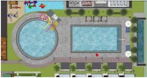
Gambar 12 Kajian Pemodelan