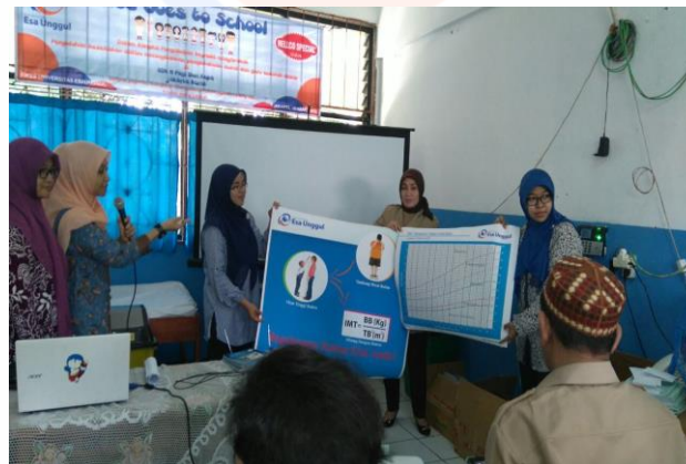
Gambar 4: Pemberian kenang-kenangan untuk UKS

Pembukaan Undang-Undang Dasar Negara Republik Indonesia Tahun 1945 mengamanatkan bahwa salah satu unsur kesejahteraan umum adalah mewujudkan derajat kesehatan yang optimal, derajat kesehatan yang optimal dapat terlaksana melalui pelayanan kesehatan yang prima salah satunya melalui penyelenggaraan rekam medis. Permasalahan utama yang sering terjadi pada pelaksanaan rekam medis adalah tenaga kesehatan tidak menyadari manfaat dan kegunaan rekam medis sehingga rekam medis dibuat tidak lengkap, tidak jelas dan tidak tepat waktu.