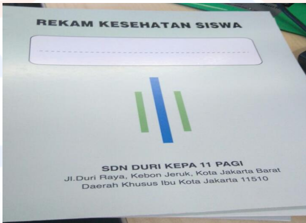
Gambar 1 Buku Rekam Kesehatan Personal Siswa

mempermudah pendokumentasian data kesehatan siswa/siswi. Program terakhir adalah Program Revitalisasi UKS, program ini berupaya memperbaiki fasilitas UKS yang ada dengan menata seluruh peralatan kesehatan karena UKS di SD N Duri Kepa 11 Pagi masih belum berfungsi dengan maksimal akibat adanya pemakaian dua sekolah dalam satu gedung.