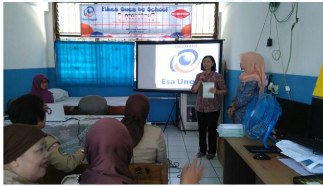
Gambar 3: Penyuluhan pencatatan identifikasi kesehatan dan rekam kesehatan personal siswa