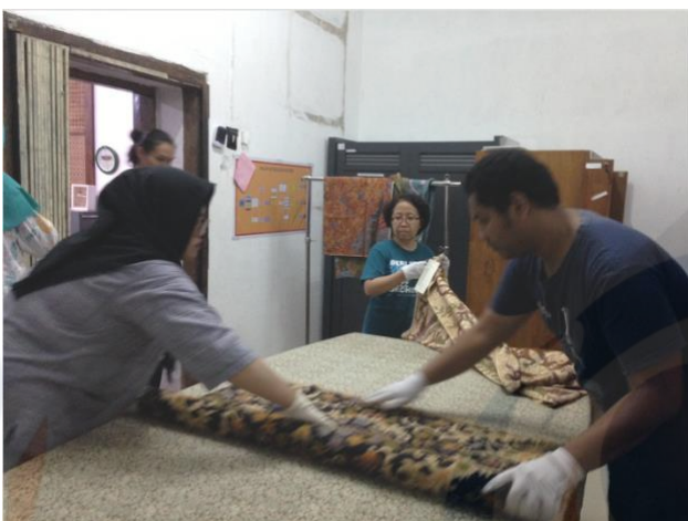
Gambar 10 Menyimpan Kembali Koleksi Kain Batik Pekalongan

Setelah pemotretan dilaksanakan, setiap kain Batik Pekalongan digulung kembali dengan menyelipkan kertas di dalam gulungan tersebut, agar kain batik tidak menjadi lengket dan tetap terjaga ragam hias dan corak warnanya.