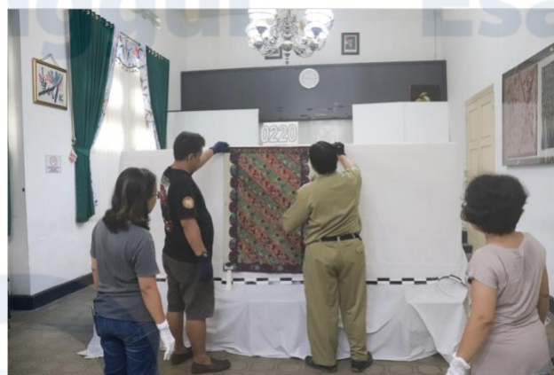
Gambar 5 Petunjuk Pemotretan Kain Batik oleh Kepala Bagian Koleksi "Museum Batik di Pekalongan"

Bimbingan teknis dalam hal penanganan koleksi museum diberikan oleh staf “Museum Batik di Pekalongan”, sehingga perlakuan terhadap koleksi kain Batik Pekalongan sesuai dengan prosedur museum yang telah ditetapkan.