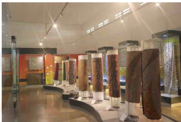
Gambar 4 Ruang Pamer Koleksi Batik

Badan Promosi Pariwisata Kota Pekalongan menyatakan, terwujudnya “Museum Batik di Pekalongan” yaitu untuk menjadi tempat pelestarian batik sebagai warisan budaya Indonesia, sehingga dapat meningkatkan minat masyarakat terhadap batik Indonesia. Terdapat lima ratus lembar kain Batik Pekalongan yang dipamerkan secara informatif dan edukatif di museum. Oleh karenanya, saat ini “Museum Batik di Pekalongan” telah menjadi pusat riset dan pengembangan ilmu desain batik, serta menjadi pusat data dan informasi tentang Batik Pekalongan.