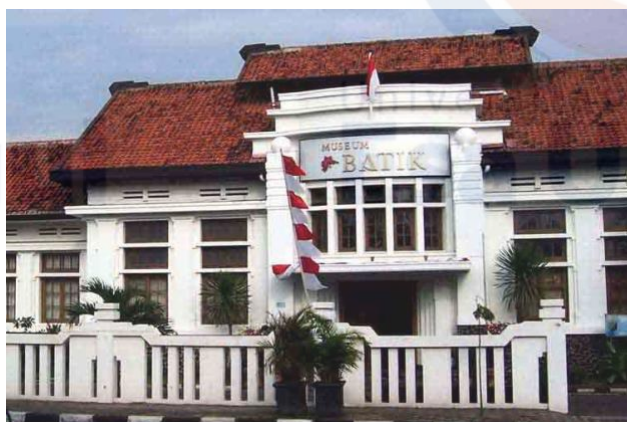
Gambar 1 Lokasi "Museum Batik di Pekalongan"

Pekalongan” menempati gedung yang berfungsi sebagai kantor keuangan pada masa penjajahan kolonial Belanda. Lokasinya terletak di Jl. Jetayu No. 1, Pekalongan 51152.