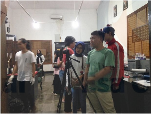
Gambar 8 Pemotretan Kain Batik Pekalongan oleh Mahasiswa Prodi Desain Komunikasi Visual