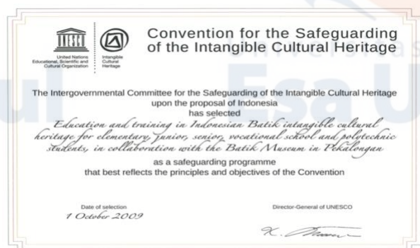
Gambar 2 Convention for the Safeguarding of the Intangible Cultural Heritage

Bersamaan dengan pengakuan batik sebagai the Intangible Cultural Heritage of Humanity (warisan budaya tak benda manusia) pada tahun 2009, maka „Museum Batik di Pekalongan“ ini juga mendapatkan penghargaan khusus, yaitu sebagai Best Practices (praktek terbaik) dari UNESCO berdasarkan aktivitas-aktivitas yang telah dilaksanakan untuk pelestarian budaya batik.