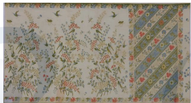
Gambar 11 Kain Batik Pekalongan Buatan Tahun 1930an

Gambar-gambar di bawah ini merupakan contoh dari hasil pendokumentasian kain Batik Pekalongan koleksi dari „Museum Batik di Pekalongan“ dengan memanfaatkan digitalisasi fotografi: