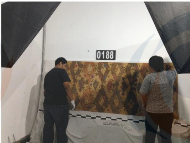
Gambar 9 Pemotretan Kain Batik Pekalongan oleh Mahasiswa Prodi Desain Komunikasi Visual