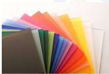
Gambar 5. Akrilik