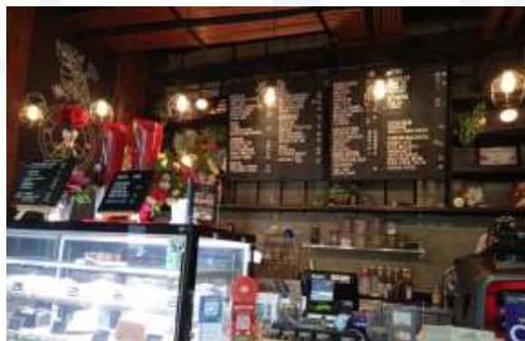
Gambar 3. Penggunaan Warna pada Papan Menu Restoran & cafe

Sedangkan persepsi warna hitam, sebagai warna yang paling gelap menjadi lambang untuk sifat gulita dan kegelapan. Hitam berkesan elit, elegan, memesona, kuat, dan rendah hati. Karena hitam juga menyiratkan pencerahan, warna ini dapat digunakan untuk tujuan khusus.