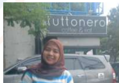
Gambar 2. Survei lapangan

Penulis melakukan penelitian secara mendalam pada Cafe dan restoran Tuttonero yang berlokasi di Jl. Panjang No.16, RT.6/RW.11, Kb. Jeruk, Kec. Kb. Jeruk, Kota Jakarta Barat, Daerah Khusus Ibukota Jakarta 11530 - Jakarta Barat.