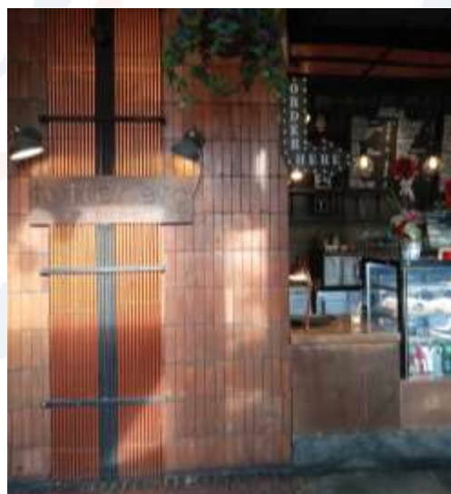
Gambar 4. Papan Informasi Tuttonero Cafe

Jenis restoran berdasarkan makanan dan minuman serta kegiatan yang ada di dalamnya, Tuttonero Cafe termasuk di dalamnya menyediakan sebagai coffe shop, caferia, cafe dan terrace restaurant. Adapun beberapa faktor dan strategi didalam wayfinding system , antara lain; unsur kedalaman, skala dan ukuran, konteks, tipografi, tingkat ketahanan, warna.