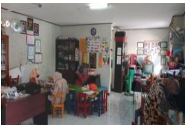
Gambar 6 Survey Awal PAUD Anggrek Rosalina 011

Berikut merupakan dokumentasi kegiatan yang telah dilakukan oleh tim pengabdian masyarakat Fakultas Desain dan Industri Kreatif Universitas Esa Unggul, mulai dari survey awal, tahap pelaksanaan, dan juga tahap diskusi pelaksanaan dengan mahasiswa.