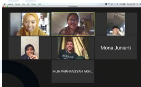
Gambar 8 Group diskusi tim pengabdian kepada masyarakat - dilakukan melalui media zoom