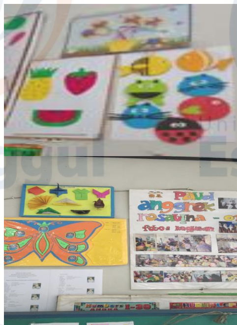
Gambar 7 Survey Awal PAUD Anggrek Rosalina 011-karya siswa