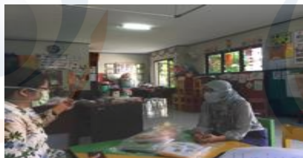
Gambar 7 Pertemuan dengan perwakilan PAUD Anggrek Rosalina 011