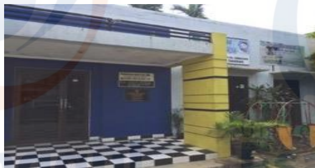
Gambar 2 Tampak Depan PAUD Rosalina 011

Sekolah PAUD Anggrek Rosalina dipimpin oleh kepala sekolah bernama Dra.Anik Warda. Lokasi sekolah yang berada ditengah perumahan nasional 2 Kota Tangerang menjadi salah satu PAUD yang diandalkan warga sekitar karena berada ditengah-tengah perumahan sehingga menjadi strategis, lokasi ini dijadikan lokasi kegiatan pengabdian masyarakat oleh tim Fakultas Desain dan Industri Kreatif Universitas Esa Unggul. PAUD Anggrek Rosalina 011 memiliki bangunan yang multifungsi karena difungsikan juga sebagai tempat untuk melaksanakan kegiatan posyandu dan poswindu bagi masyarakat setempat. Hingga saat ini PAUD Anggrek Rosalina 011 telah banyak membantu berbagai macam kegiatan dan aktif dalam mengikuti perlombaan yang diselenggarakan oleh kecamatan Cibodas Kota Tangerang.