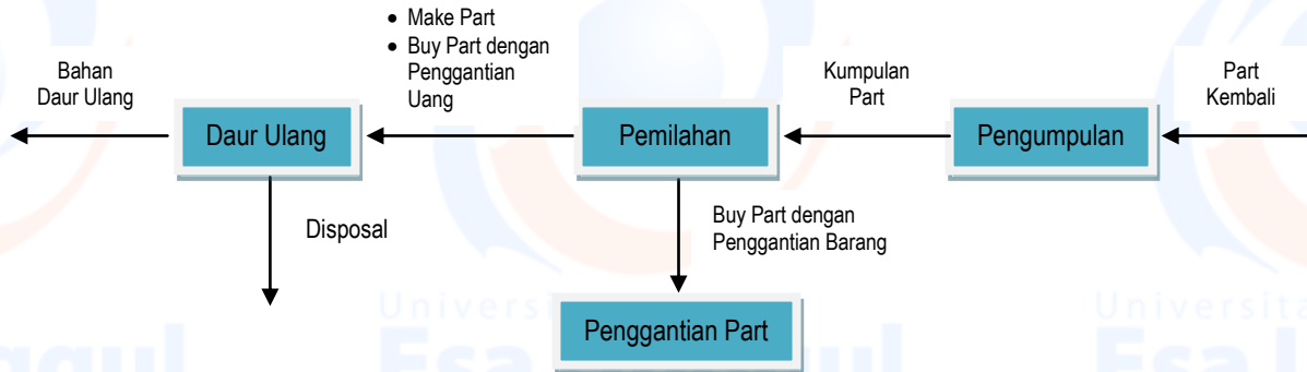
Gambar 1 Rancangan reverse logistics pada industri daur ulang komputer

dikirimkan ke fasilitas daur ulang ( recycling ) yang dimiliki oleh manufacturer . Demikian juga untuk kumpulan buy part yang tidak dapat diganti dengan part baru dari pemasok yang dikarenakan ketiadaan persediaan part sejenis atau melewati masa garansi maka akan dikirimkan ke fasilitas daur ulang tersebut.