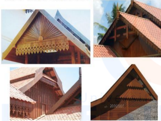
Gambar 2 konsep carum lamp