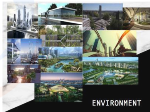
Gambar 5 lingkungan user

Lampu rotan carum akan ditempatkan di tengah kepadatan penduduk di kota dengan aktivitas bisnis terbuka seperti rumah-rumah mewah ataupun appartement .