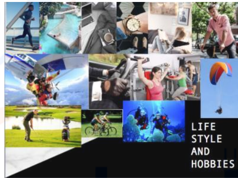
Gambar 4 life style and hobbies

Gaya hidup user ditujukan untuk pengguna yang memiliki gaya hidup cenderung mewah dan memiliki hobi yang juga mewah karena mobilitas pengguna yang tinggi membuat gaya hidup serta hobi sangat mengikuti trend yang ada.