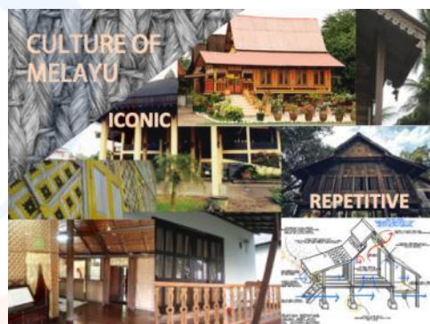
Gambar 6 culture melayu