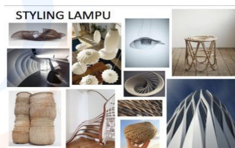
Gambar 1 styling dari carum lamp

Hijau adalah warna kuning-hijau segar dan cerah yang membangkitkan hari-hari pertama musim semi ketika hijau alam hidup kembali, pulih dan diperbarui. Menggambarkan dedaunan yang subur dan kehijauan alam terbuka yang luar biasa, atribut yang kuat dari Greenery memberi sinyal kepada konsumen untuk mengambil napas dalam-dalam, beroksigen, dan menyegarkan kembali. Hijau adalah netral dari alam. Semakin banyak orang yang tenggelam dalam kehidupan modern, semakin besar keinginan bawaan mereka untuk membenamkan diri dalam keindahan fisik dan kesatuan yang melekat dari dunia alami. Pergeseran ini tercermin dari menjamurnya semua hal yang ekspresif dari penghijauan dalam kehidupan sehari-hari melalui perencanaan kota, arsitektur, gaya hidup, dan pilihan desain secara global. Sebuah konstanta di pinggiran, Greenery sekarang ditarik ke garis depan - ini adalah rona di mana-mana di seluruh dunia. Sebuah naungan yang menguatkan kehidupan, Greenery juga merupakan lambang dari pengejaran gairah dan vitalitas pribadi. Konsep dari lampu carum ini sendiri adalah menciptakan lampu yang modern, ramah lingkungan, dan nyaman bagi pengguna serta mengangkat budaya melayu sehingga budaya tersebut menjadi salah satu desain yang ikonik dalam era modernisasi ini.