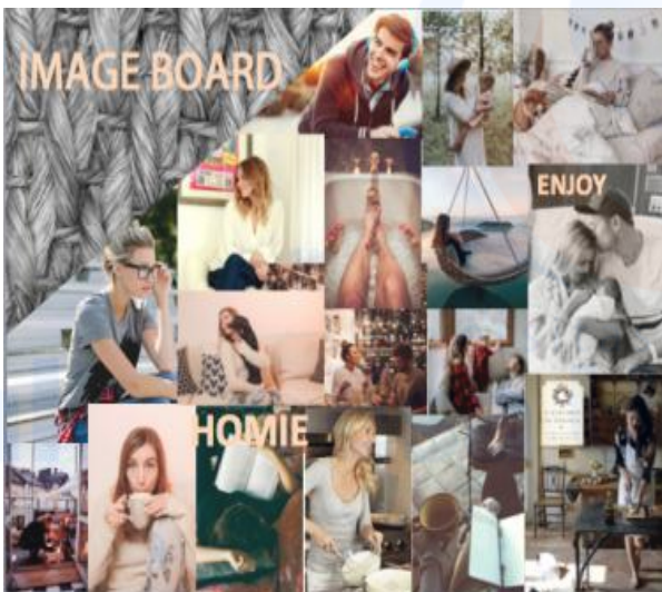
Gambar 3. user

Dalam perancangan ini, peneliti menentukan user yang memiliki tingkat mobilitas yang tinggi dan hanya memiliki waktu beristirahat di rumah dengan mengusung konsep yang homie dan nyaman bagi para user. User masih produktif dalam bekerja dan menggambarkan personal yang memiliki sifat menikmati hidup, kekeluargaan dan modern di dalam masyarakat. Aktivitas user yang selalu aktif dan dinamis serta sangat memiliki waktu yang minim di rumah namun memiliki sifat yang senang di rumah dan memiliki sikap yang hangat dan kekeluargaan.