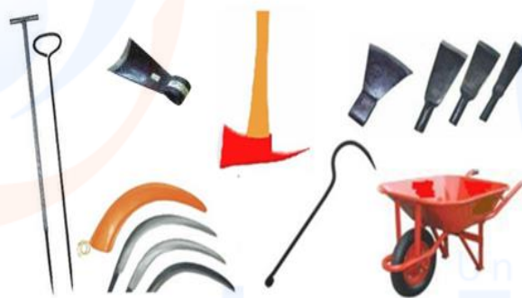
Gambar 2 Alat panen kelapa sawit

menusuk untuk dodos dan gerakan menarik untuk egrek (Fauzi dkk, 2012).