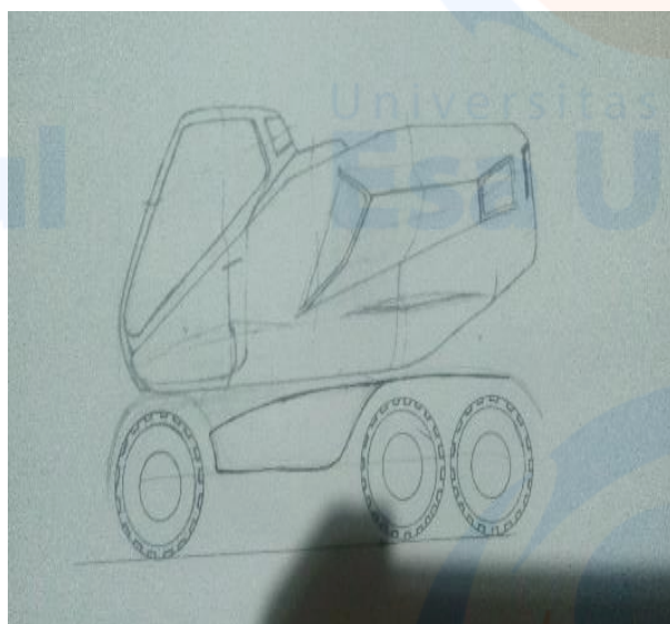
Gambar 7 Manual sketsa

Sebelum ke tahap sketsa produk, saya melakukan analisis terlebih dahulu terhadap beberapa bentuk alat transportasi kelapa sawit yang ada di pameran dengan menganalisa bentuk dan ukurannya. Selanjutnya sayamelakukan Proses desain sketsa yang memakan waktu kurang lebih sekitar dua minggu.