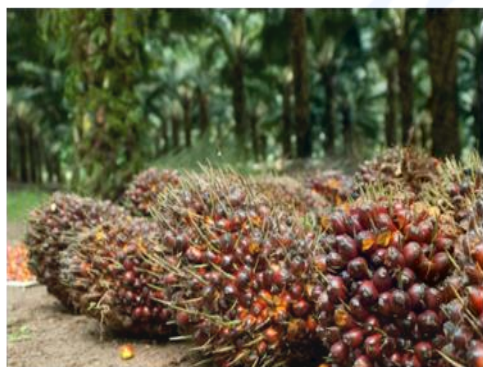
Gambar 1 Tandan buah sawit

pengangkutan panen, dan pengawasan panen (Pusat Penelitian Kelapa Sawit, 2009). proses pemanenan merupakan hal yang penting karena sangat menentukan rendeman dan kualitas minyak sawit. Tandan buah segar (TBS) hasil pemanenan harus segera diangkut ke pabrik untuk diolah. Buah yang tidak segera diolah akan menghasilkan minyak dengan kadar asam lemak bebas (ALB) yang tinggi. Peningkatan ALB dapat dicegah dengan pengolahan yang dilakukan paling lambat 8 jam setelah panen (Lubis, 2012). Namun persoalannya, banyak ditemukan kondisi infrastruktur lahan kebun sawit yang buruk, dan tidak tersedianya alat transportasi buah sawit. Selama ini untuk mengangkut buah sawit dilakukan secara manual, dengan pekerja menggunakan angkong ataupun pikulan. Buah sawit ditampung di penampungan sementara di pinggir jalan, terutama saat musim hujan. Bisa ribuan ton buah sawit tidak terangkut gara-gara tidak ada alat transportasi yang membawanya keluar. Resikonya buah menjadi busuk atau kadar asam lemak bebas menjadi sangat tinggi. Menyebabkan kualitas minyak sawit menjadi kurang bagus.