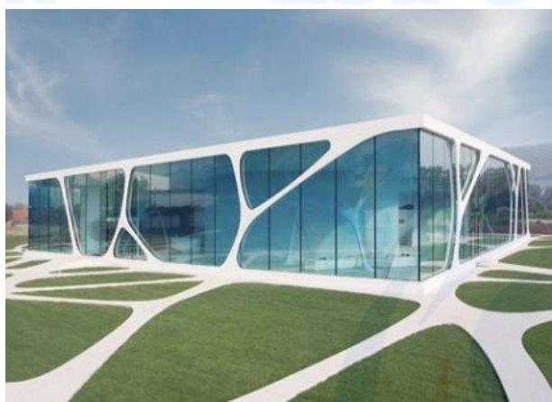
Gambar 3 Organik arsitektur

Dia ingin mereka membayangkan bentuk dan fungsi sebagai kesatuan, elemen yang saling berhubungan. di antara banyak struktur terkenal yang dirancang oleh Wright, dua yang paling terkenal adalah: Fallingwater dan Unity Temple. Dengan menerapkan konsep desain yang organik akan menjadi unique selling point pada transportasi ini.