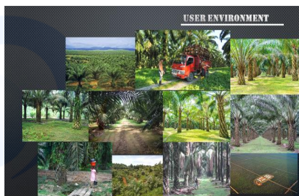
Gambar 5 Enviroment