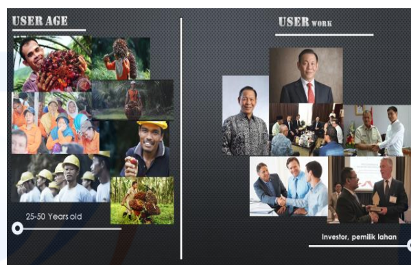
Gambar 4. User

Dalam perancangan desain transportasi ini user yang ditargetkan adalah seorang petani pekerja keras yang berusia 25-50 tahun. Pemilik lahan sawit yang ingin menambah kualitas para pekerja nya, serta investor baik itu investor kelapa sawit maupun penikmat desain.