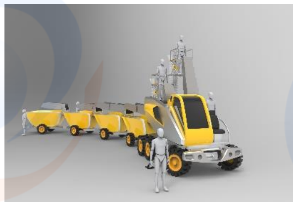
Gambar 9 Hasil Render

Luxion KeyShot memiliki satu-satunya mesin rendering yang disertifikasi oleh CIE (International Commission on Illumination). Menggunakan bahan ilmiah yang akurat dan pencahayaan dunia nyata, KeyShot memberikan gambar yang paling akurat dalam hitungan detik.