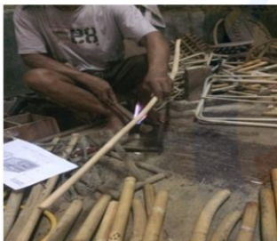
Gambar 5 proses pelengkungan rotan

Pada proses ini disebut juga tahapan awal untuk menguji kelayakan bahan rotan dalam aplikasi untuk memenuhi tuntutan bentuk dari perancangan atau desain. Pada tahap ini, pelengkungan rotan tetap dengan cara memanaskan rotan terlebih dahulu, hanya saja alat pemanas yang digunakan lebih mudah dalam penggunaannya. Terdapat lengkungan pada bagian-bagian tertentu dari desain yang direncanakan oleh peneliti. Bagian tersebut merupakan bentuk yang harus dilakukannya proses pelengkungan, yang dalam hal ini pelengkungan yang dikerjakaan sebesar sudut 90°.