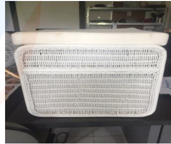
Gambar 18 Purwarupa