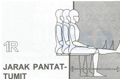
Gambar 3: Jarak dari Pantat - Tumit

Karena jarak bersih adalah faktor perancangan yang berlaku, maka data yang digunakan adalah data persentil 95.(Panero, Zelnik, 2003).