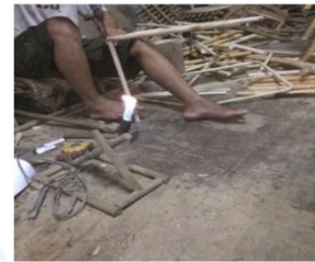
Gambar 6 proses penyambungan rotan

Aspek estetika, Aspek tradisional, Aspek ergonomic, Aspek fungsi, dan Aspek sains dan teknologi