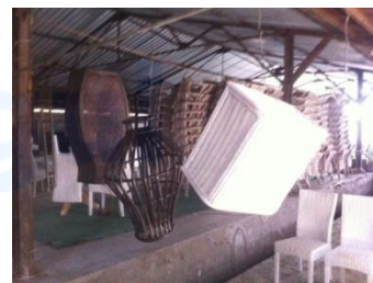
Gambar 7 proses pewarnaan rotan

Dalam teknik ini, juga terlihat lebih modern dengan penggunaan teknik semprot yang lebih mudah dan juga cepat kering. Banyak berbagai cara dalam pewarnaan rotan, namun demi mempersingkat waktu dan biaya, maka peneliti menggunakan proses semprot dalam pewarnaannya