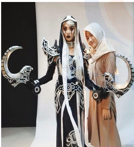
Gambar 11 Dokumentasi Cosplayer dengan penulis

Untuk proses pembuatan sisik pada pegangan pedang saya menggunakan kain keras yang dilapisi terlebih dahulu dengan lem PVC kemudian setelah kering saya melapisinya dengan cat dan melukis sisik pada bagian belakang kain kemudian menggantungnya mengikuti pola sisik. Setelah didapatkan pola sisik yang diinginkan lalu tahap selanjutnya adalah melekatkan sisik pada pegangan pedang dengan glue gun .