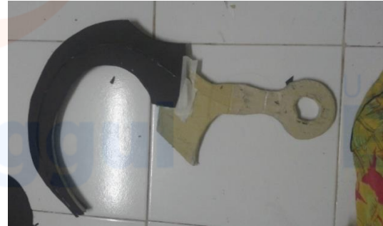
Gambar 6 Pembuatan Kerangka Pedang

langkah awal pembuatan pedang adalah membuat konstruksi pola bentuk dari hard board dan infra board , lalu keduanya diberi lem dan direkatkan menjadi lapisan, untuk membuat kemiringan pada pisau saya menggunakan busa hati sebagai bantalan yang dibentuk menyerupai kemiringan pisau.