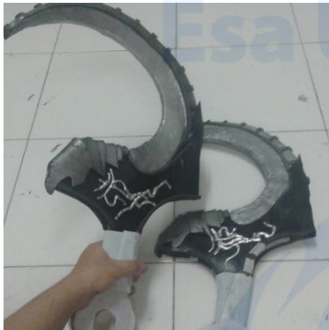
Gambar 10 Perakitan detail pedang