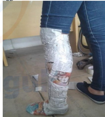
Gambar 1 Wrapping pola sepatu

dan selotip plastik bening tujuannya untuk mendapatkan ukuran yang pas dengan tubuh model yang menggunakan kostum.