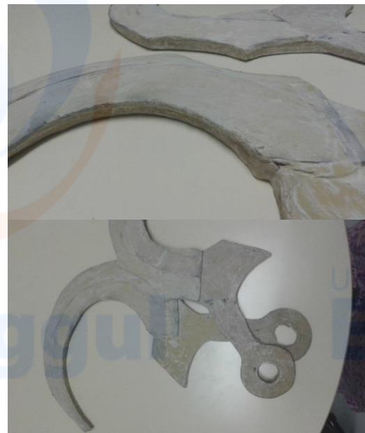
Gambar 7 Proses Dempul Pedang

lalu selanjutnya agar teksturnya keras saya melapisi bantalan dengan dempul.