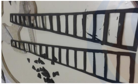
Gambar 9 Pemotongan Detail Pedang