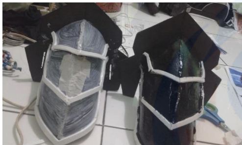
Gambar 5 Proses pengecatan

Setelah semua bagian terbentuk, tahapan selanjutnya adalah proses pengecatan, sebelumnya seluruh permukaan dilapisi dengan lem putih atau lem PVC supaya pori pori tertutup dan membuat hasil cat tampak halus.