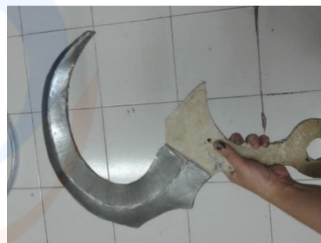
Gambar 8 Pewarnaan Pisau Pedang