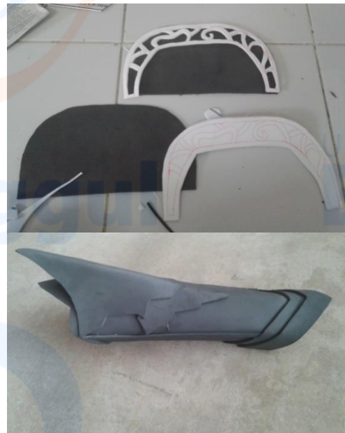
Gambar 2 Pemotongan beberapa pola bagian

Setelah proses wrap selesai langkah selanjutnya adalah memecah pola dengan cara memotong pada bagian sisi atau sambungan kostum, setelah mendapatkan pola yang diinginkan selanjutnya adalah memotong pola pada busa hati atau eva foam sesuai dengan pecahan pola, pemotongan pola menggunakan pisau cutter dan gunting.