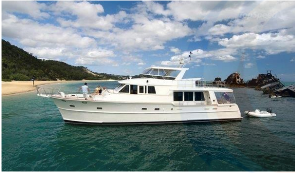
Gambar 4: Aleutian Series

Dalam setiap seri kapalnya, Grand Banks telah berupaya untuk menangkap semangat ideal bagi wisatawan baharidan juga bagi orang-orang yang antusias terhadap produk dari GB - dan mengkombinasikannya dalam filosofi desain state-of-the-art pada peralatan kapal, pengerjaan yang sangat teliti, dan teknik konstruksi yang unggul. Hal ini alasan Grand Banks yacht telah menjadi ikon pembuat kapal yang cerdas di seluruh dunia, dan mengapa mereka terus memenuhi standar tinggi yang cerdas, semua hal yang dituntut pelaut hari ini.