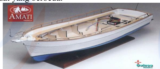
Gambar 8 Garis kayu pada lambung GB

Sejarah perusahaan mengatakan bahwa kapal GB awal mulanya dibuat menggunakan bahan dasar kayu seluruhnya. Garis-garis yang terbentuk dari sambungan kayu yang membetuk lambung kapal diyakini sebagai pola tradisi bagi pelaut dimanapun. Garis inilah yang dipertahankan oleh GBYSB dalam mencoba mempertahankan garis tradisional dan memberikan desain yang sama walau dengan bahan pembuat yang berbeda.