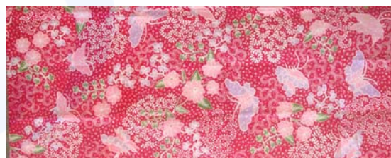
Gambar. 8 Mmotif batik sarung batik pesisir

Ragam hias ceplok mempunyai kerangka terukur persegi dan simetris, tetapi isinya kadang-kadang mempunyai bentuk organis. Ragam hias ceplok memiliki pola ulang teratur dengan sambungan seperti ubin. Ada banyak ragam hias ceplok, antara lain kembang waru, puspa tanjung, jambang, ayam puger, ceplok mundu dan sebagainya. Ceplok merupakan stilasi dari berbagai objek. Ceplok sebagai ragam hias batik pesisir ditandai dengan banyak warna, seperti merah, hitam biru kuning emas dsbnya.