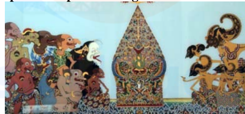
Gambar : Ilustrasi Punokawan dan Pandawa

Dewasa ini banyak galeri yang tidak optimal dalam penyajian pameran dengan desain interiornya khususnya “vitrin”, sehingga estetika dan fungsi di galeri itu terkadang kurang ideal bahkan hilang sama sekali saat pengunjung berada di dalam galeri. Padahal itu merupakan salah satu modal yang besar bagi galeri untuk menonjolkan keunikannya dan fungsinya. Secara umum gaya perancangan vitrin untuk kain batik yang tepat dapat di usulkan adalah hasil dari transformasi motif batik “kawung” pada vitrin dengan pendekatan analogi dalam perancangan. Alasan pemilihan motif batik kawung karena memiliki filosofi yang tinggi sebagai “wadah”. Adapun Kawung, yang dilihat sebagai Kostum Punokawan, jangan berkecil hari, Karena Punokawan adalah Jelmaan Dewa yang dikutuk ke Bumi dan menghamba pada Pandawa. Jadi filosofinya tinggi, sebagai “wadah” atau pembantu bagi yang utama yaitu Raja (keluarga Pandawa). Punakawan dan Pandawa, adalah sejoli, seperti vitrin dengan batiknya. Vitrin sbg simbol Punokawan (wadah) yang disimbolkan berupa ide gagasan bentuk based on stilisasi / penyederhaan motif batik. Dengan adanya desain interior khususnya vitrin untuk koleksi kain batik tulis ini diharapkan tercipta sebuah penyajian vitrin yang ideal untuk batik tulis sebagai karya adiluhung.