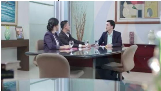
Gambar 2 Contoh Materi Video ILM Mudik Versi Keselamatan

Aspek konatif selanjutnya adalah mengukur perubahan perilaku yang akan atau sudah dilakukan oleh respnden setelah melihat iklan tersebut. Secara keseluruhan responden akan/ sudah melakukan membawa barang seperlunya disaat mudik, yaitu sebesar 62.8%. Kemudian yang kedua adalah merencanakan perjalanan sebaik mungkin sebesar 51.6% dan yang ketiga adalah datang lebih awal sebesar 29.0%. Untuk responden di Semarang justru yang ketiga adalah mematuhi semua prosedur sebesar 32.0%.