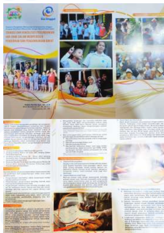
Gambar 5 Materi Brosur

Materi-materi berkenaan perlindungan hak anak dalam pendidikan dan pengembangan bakat di atas dirangkum dalam brosur yang disebar kepada 30 peserta sebagai bentuk edukasi terkait tema yang disampaikan. Kegiatan penyebaran brosur dilaksanakan di Rumah Pintar Aisha pada tanggal 18 Juli 2020.