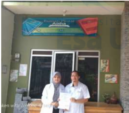
Gambar 1 Penandatanganan Surat Kesediaan Mitra