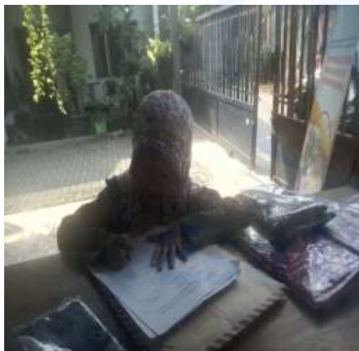
Gambar 2 Pengisian Kuesioner