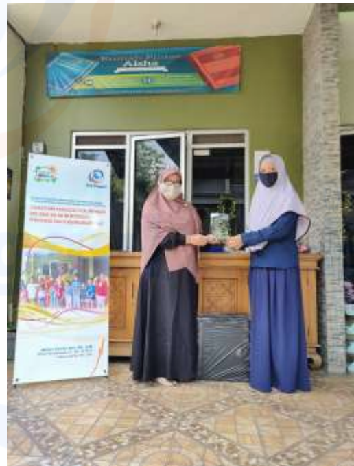
Gambar 4 Penyerhan Plakat